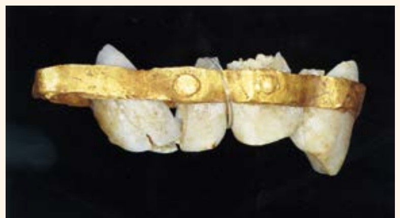
Figura 5. Prótesis con dos incisivos superiores (Palestrina).