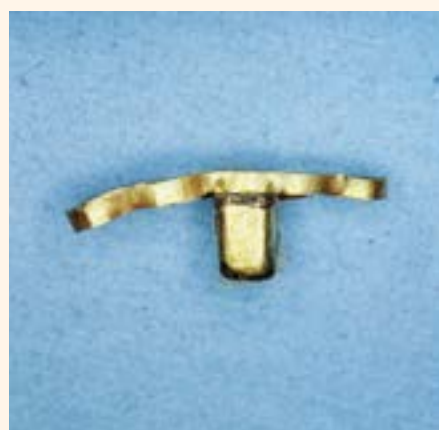
Figura 4. Incisivo inferior con corona de oro (Satricum, siglo VI a.C).