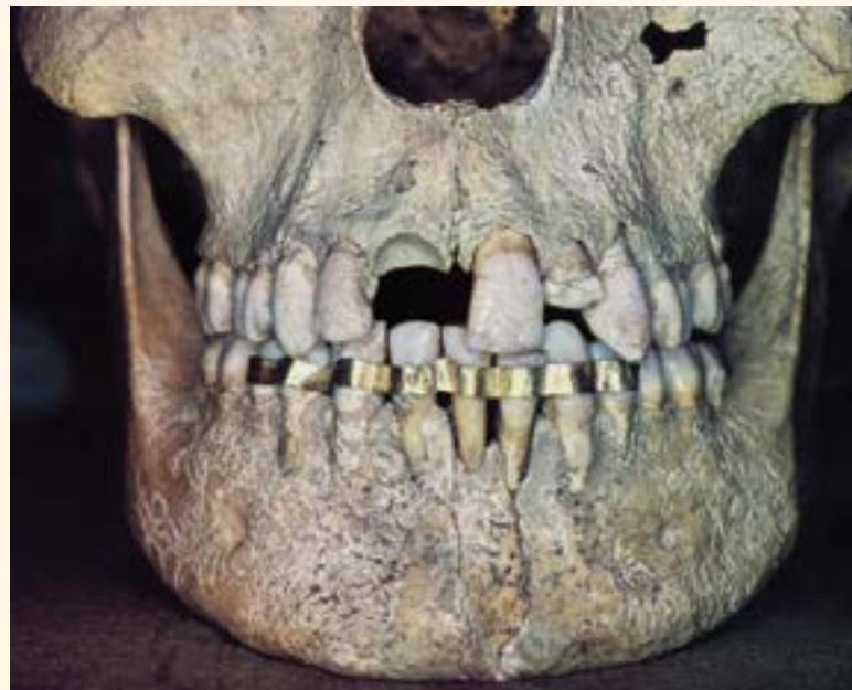
Figura 2. Ferula (Chiusi, siglo IV a.C).