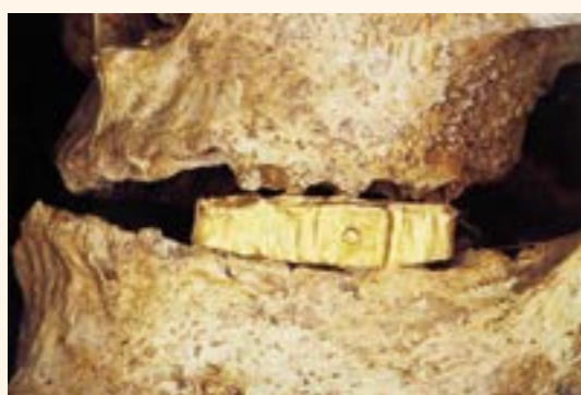
Figura 6. Puente inferior derecho (Civita Castellana).