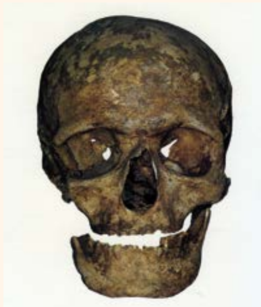
Figura 1. Craneo etrusco con puente inferior izquierdo.

Profesor de Historia de la Odontología. Presidente de la Academia Española de Estudios Históricos de Odontología y Estomatología.