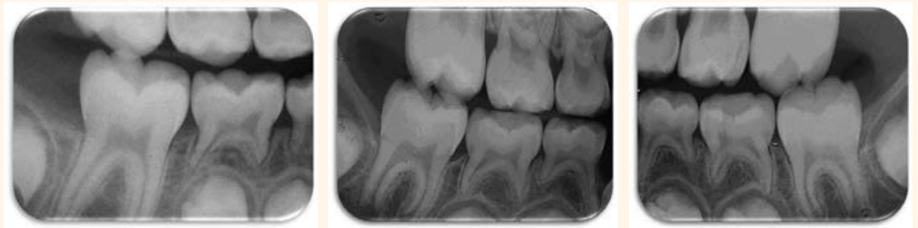
Figura 1. Segundo molar inferior derecho donde se puede observar la reabsorción radicular inesperada en la raíz mesial y, aunque no se aprecia en su totalidad, en la raíz distal de primer molar.

otorgado por los padres o responsables legales.