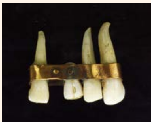
Figura 3. Puente etrusco (Museo de la Escuela Dental de París).

Profesora de la Universidad CEU San Pablo. Máster en Implantología