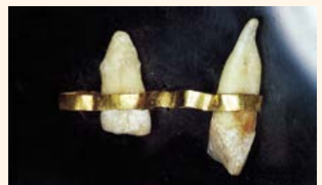
Figura 8. Prótesis para cinco piezas (Tarquinia).