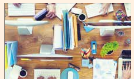
DTI Publishing Group ofrece ahora un sofisticado servicio de relaciones públicas para empresas dentales (Foto: Rawpixel.com/Shutterstock).

• Medios sociales y digitales: Muchas compañías dentales usan Facebook, YouTube o Twitter para interactuar con sus clientes, pero ¿qué canal se adapta mejor a las necesidades de la empresa? Nuestra gama de medios sociales y digitales incluye consultoría en comunicación social, seguimiento y publicidad, así como diseño de páginas web complejas. Además, DTI Communication Services analiza la página web de la compañía respecto a gramática, ortografía y palabras clave