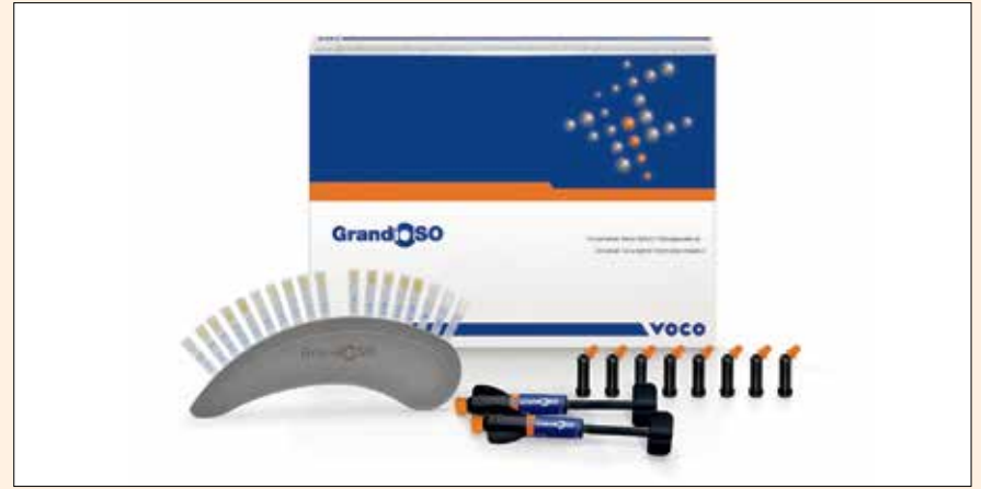
GrandioSO, el material de obturación nanohíbrido para restauraciones anteriores y posteriores.