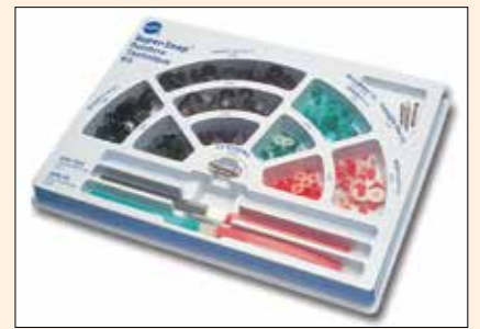
El impresionante estuche de pulido y acabado Super-Snap Rainbow Technique Kit, desarrollado por Shofu.

Los discos Super-Snap están diseñados para utilizarse en conjunto con las Su-