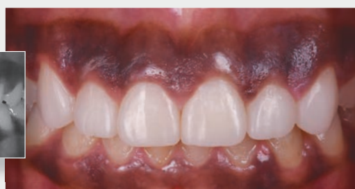
Form enhancement of 6 anterior teeth: Body i1 & Skin Bleach