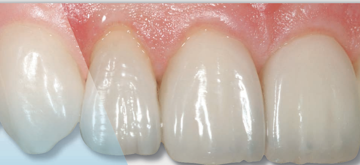
6 direct veneers in upper front teeth: Body i2 & Azur Effect & Skin White

SHADING TECHNOLOGY DOUBLE CONSISTENCY SURFACE GLOSS ERGONOMICS