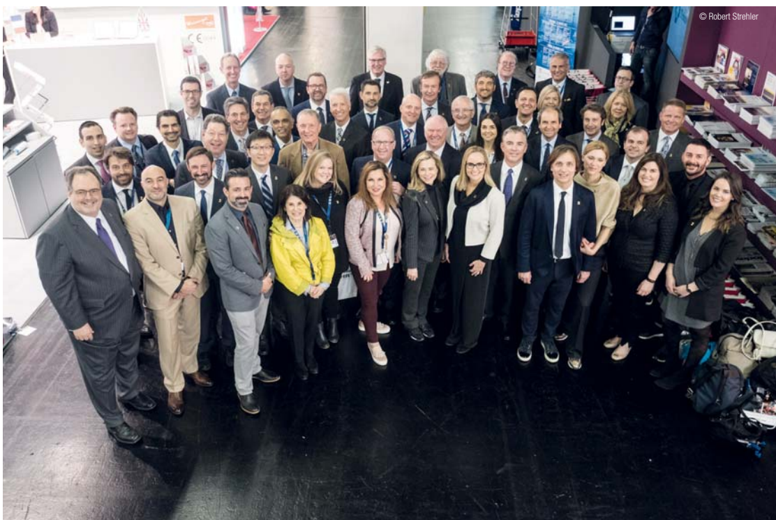
*Achtzig Dentalgrößen aus 15 Ländern trafen sich am DTI/OEMUS MEDIA-Stand zum alljährlichen Channel 3-Treffen. *Channel 3's 80 key opinion leaders from 15 countries gathered on Wednesday at the DTI/OEMUS MEDIA Lounge for their annual meeting.