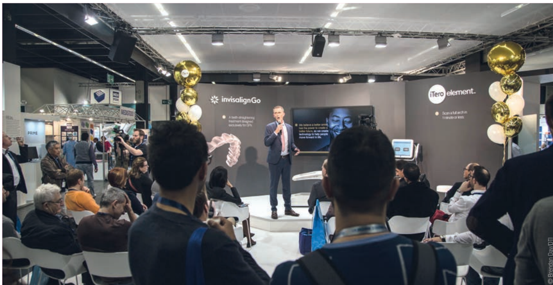
Launch of the Made to Move campaign on Wednesday.