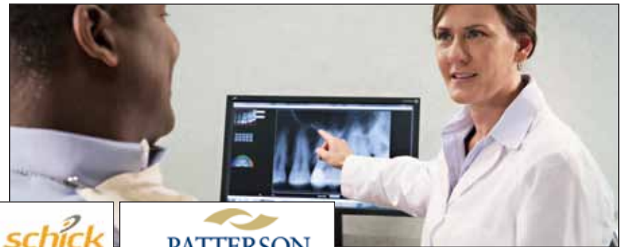
• Schick 33 de Sirona Dental, un capteur intrabuccal numérique

To learn more about Sirona Dental's Schick 33 and Patterson Dental, visit booth Nos. 1201+/1300+/1400+.