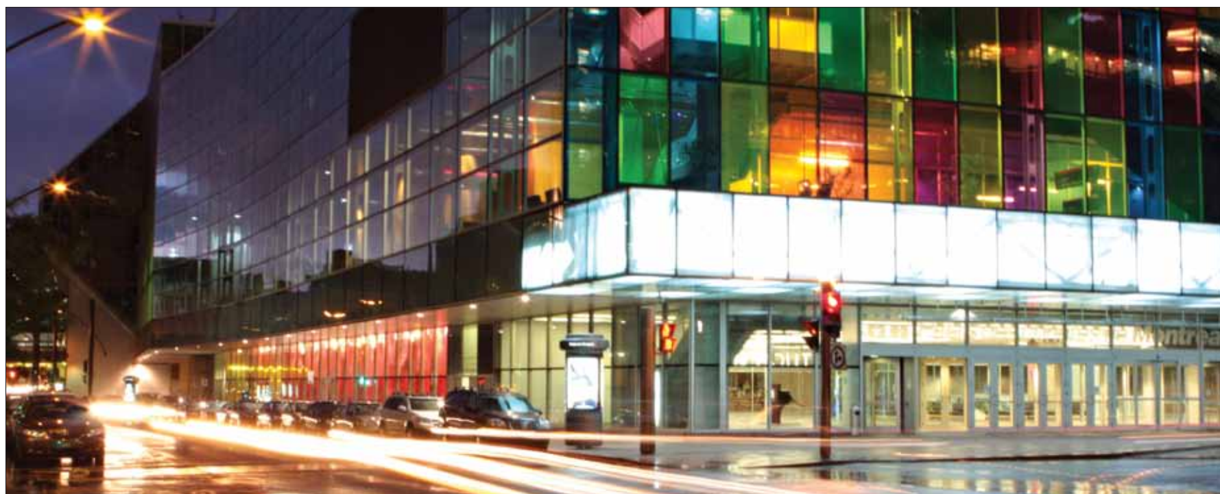
· Les murs de verre du Palais des Congrès de Montréal donnent un arrière-plan haut en couleur pour les journées dentaires internationales du Québec (JDIQ). · The glass walls of the Montréal Convention Centre provide a colourful backdrop to the Journées dentaires internationales du Québec (JDIQ).