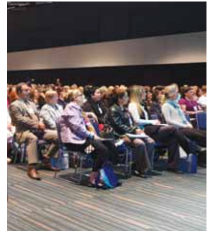
· Bien que cavernueuses, les salles de conférences des JDIQ se remplissent rapidement. · Though cavernous, the JDIQ lecture rooms often fill quickly.