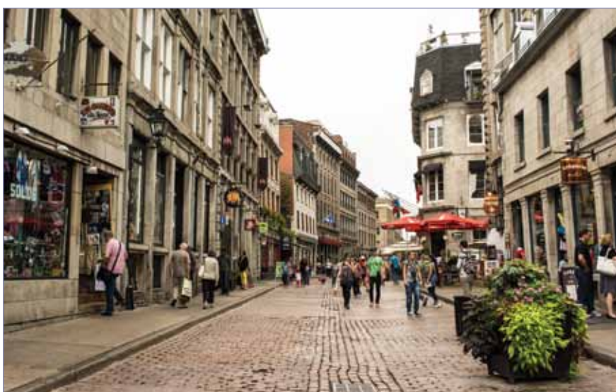
· Le Vieux-Montréal et ses rues enchantées sont à proximité du Palais des Congrès, donnant accès aux congressistes au magasinage et aux restaurants dans leurs temps libres. (Photo/Orlando G. Cerocchi, de Tourisme Montréal). · The enchanting streets of Old Montréal are just steps away from the Montréal Convention Centre, inviting JDIQ attendees to shop and dine during their time away from the meeting. (Photo/Orlando G. Cerocchi, Tourisme Montréal)