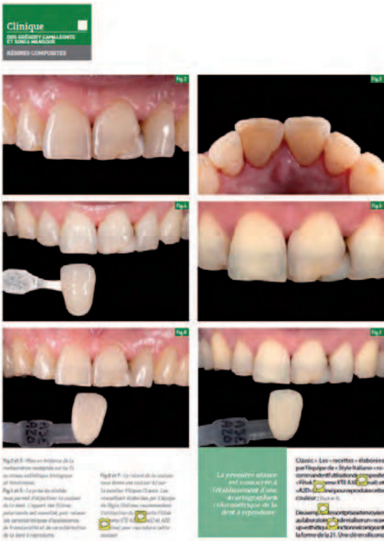
Figure 7 : la photographie est indispensable pour illustrer un article scientifique