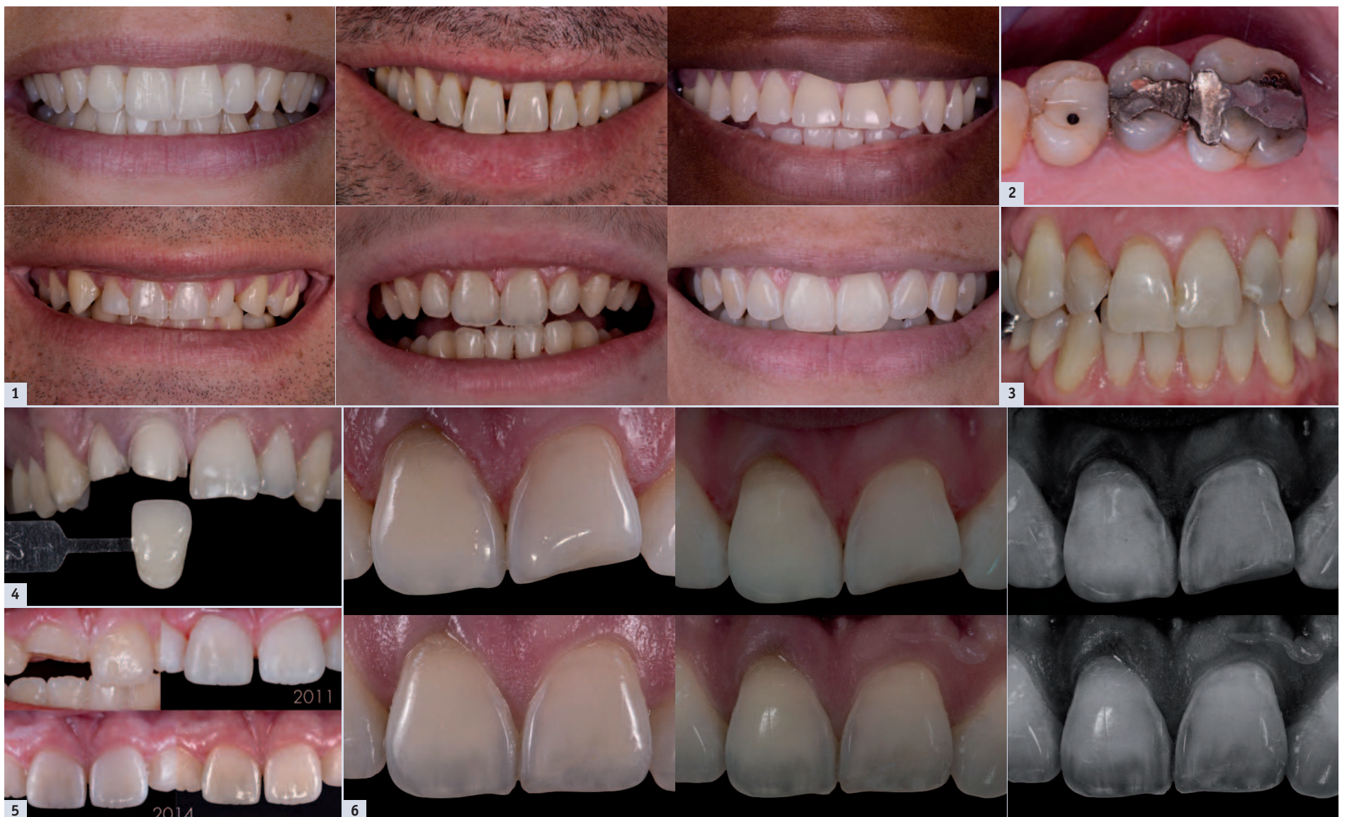
Fig. 1 : Chaque sourire est unique, chaque patient est un cas particuliers. – Fig. 2 : Restauration défectueuse à montrer au patient pour lui faire prendre conscience de la nécessité d'un traitement. – Fig. 3 : Envoyer des photos d'un patient à un correspondant permet à ce dernier de connaître la problématique avant même la venue du patient. – Fig. 4 : Transmission de la couleur au laboratoire. – Fig. 5 : Autoévaluation d'un traitement sur 3 ans. – Fig. 6 : Protocole photographique en dentisterie restauratrice.

Enfin, chaque relevé de couleur devra être accompagné d'une prise de vue sur laquelle apparaîtront les dents mais aussi un échantillon du teintier.