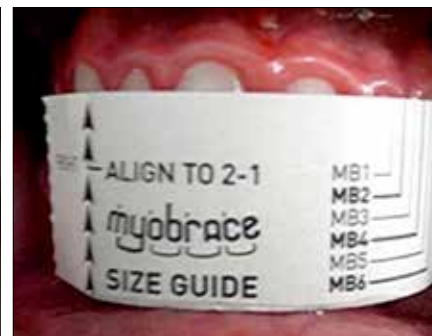
Figura 30. Guía para medir de canino a canino los Myobrace MB y MBN.