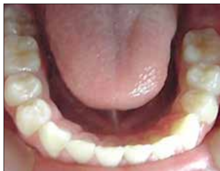
Figura 29. Armonía Lingual y de la arcada inferior.