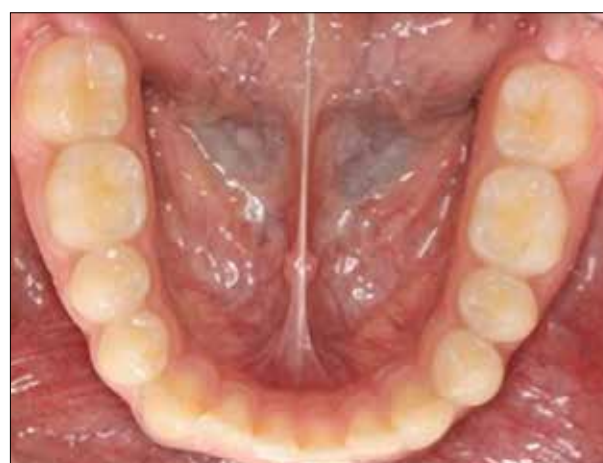
Figura 38. Arcada cuadrada.