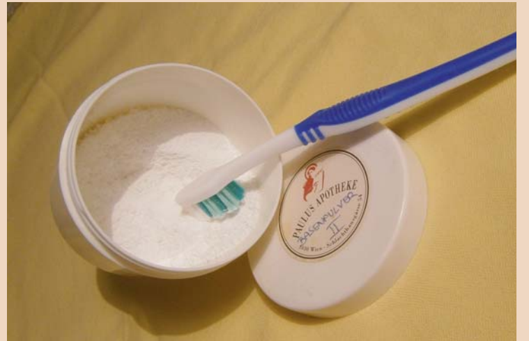
Putzen mit Soda.