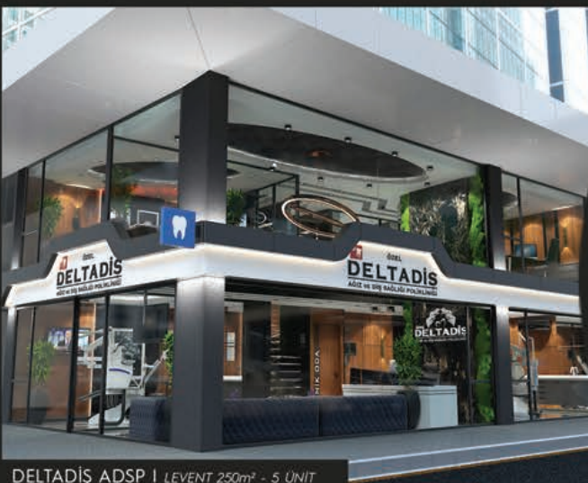
DELTAĐIŐ ADSP | LEVENT 250m 2 - 5 UNIT