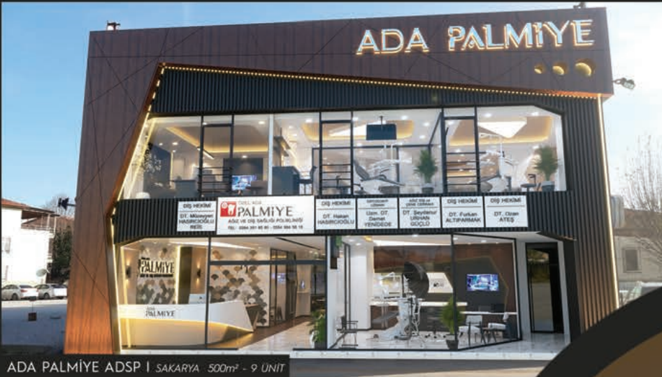
ADA PALMIYE ADSP | SAKARYA 500m 2 - 9 UNIT