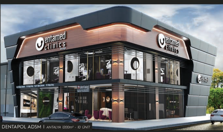
DENTAPOL ADSP | ANTALYA 1200m 2 - 10 UNIT