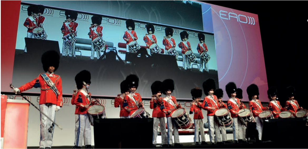
Un momento della cerimonia di apertura.

Copenaghen. Un gran numero di esperti in Implantologia si è riunito per il Congresso EAO di quest'anno.