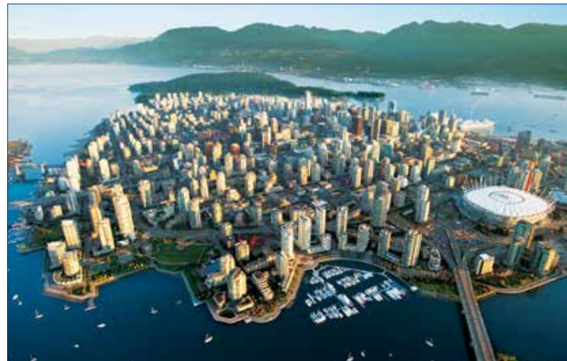
· Vancouver est la ville hôte de la Conférence Dentaire du Pacifique. · Vancouver hosts the Pacific Dental Conference.