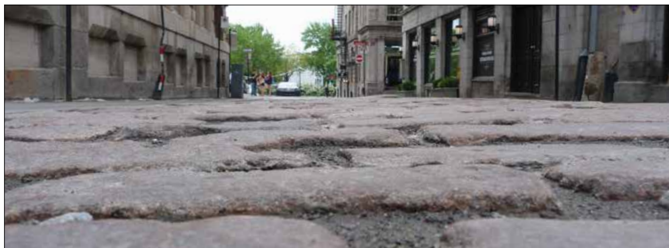
• Les rues pavées du Vieux-Montréal font partie du vaste choix d'attractions qui s'offre aux congressistes des Journées dentaires internationales du Québec. • The cobblestone streets of Old Montréal are among the endless nearby attractions awaiting attendees of the Journées dentaires internationales du Québec.

Opinions expressed by authors are their own and may not reflect those of Tribune America or Dental Tribune International.