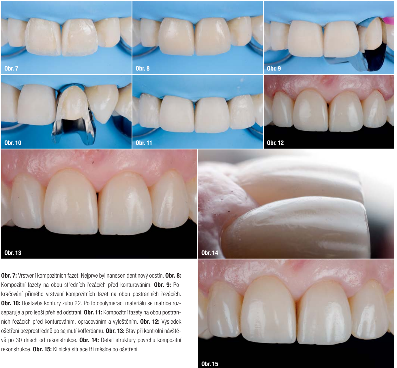
Obr. 7: Vrstvení kompozitních fazet: Nejprve byl nanesen dentinový odstín. Obr. 8: Kompozitní fazety na obou středních řezácích před konturováním. Obr. 9: Pokračování přímého vrstvení kompozitních fazet na obou postranních řezácích. Obr. 10: Dostavba kontury zubu 22. Po fotopolymeraci materiálu se matrice rozseparuje a pro lepší přehled odstraní. Obr. 11: Kompozitní fazety na obou postranních řezácích před konturováním, opracováním a vyleštěním. Obr. 12: Výsledek ošetření bezprostředně po sejmutí kofferdamu. Obr. 13: Stav při kontrolní návštěvě po 30 dnech od rekonstrukce. Obr. 14: Detail struktury povrchu kompozitní rekonstrukce. Obr. 15: Klinická situace tři měsíce po ošetření.

vány u rekonstrukcí aproximálních a cervikálních defektů. Při tom probíhala rekonstrukce ve dvou krocích se dvěma postranními matricemi (aproximální okraje) a s jednou matricovou páskou pro rekonstrukci cervikální oblasti přistřižené do požadovaného tvaru.