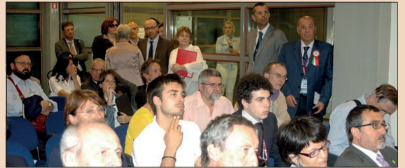
In crescendo gli Amici di Brugg 2011. Tra gli incontri più affollati, quello di Unidi/Andi di venerdì 27 in Sala Garberoglio, in cui molti sono dovuti rimanere in piedi (vedi servizio in pagina seguente).

Che cosa diversifica "questa" edizione dalle altre? "La cura particolare nell'accoglienza", dice. E spiega: "Per facilitare l'accesso all'area fieristica, sempre molto travagliato, abbiamo fatto riunioni con i vigili, migliorato la segnaletica, mettendo cartelli dappertutto. Dobbiamo dare atto all'esperienza organizzativa di Renato Scotti Di Uccio, già alto ufficiale della Sanità militare e attuale segretario dell'Associazione. Generale in quiescenza, già presidente dell'Istituto di Medicina legale dell'Esercito e dentista anch'egli, ha il merito di avere preso 'strategicamente' di petto il problema dell'afflusso, facilitato peraltro dalla nostra insistenza per le iscrizioni on-line: chi si iscriveva via Internet aveva infatti una corsia preferenziale per abbattere i ritardi e parcheggio gratuito nei tre giorni della manifestazione. Sembrano minuzie - dice Iorio -, ma sono in realtà importanti.