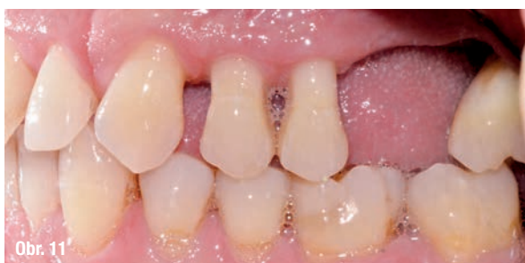
Obr. 9–13: Rozestoupení řezáků a aproximálních prostor.