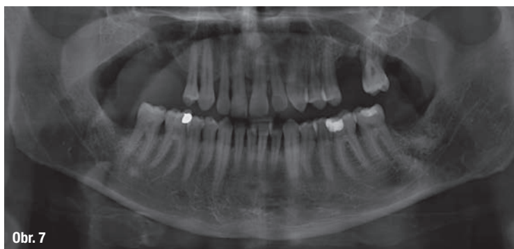
Obr. 7 a 8: Počáteční ortopantomogram a telorentgen.