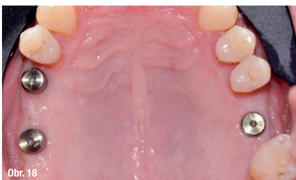
Obr. 15–21: Závěrečné záznamy ortodontické léčby.