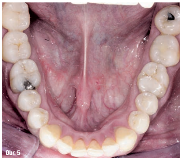
Obr. 1–5: Fotografická dokumentace počátečního stavu před parodontologickým ošetřením.