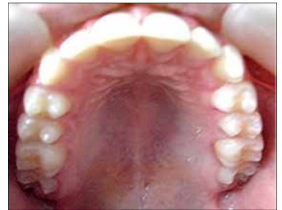
Figura 27. Amplia arcada superior.