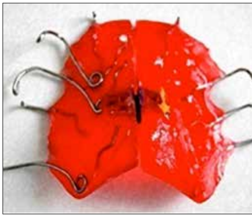
Figura 25. PATA Distaladora unilateral con tornillo.