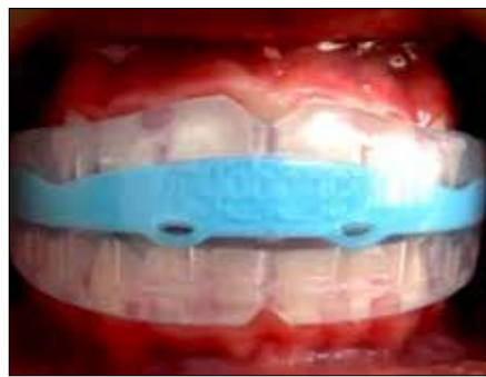
Figura 28. Myobrace MB con Dynamic Corde de Nylon.