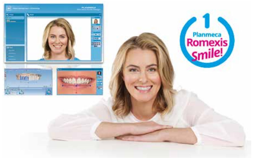
El potente y fácil de usar programa de diseño de la sonrisa Planmeca Romexis® Smile Design.