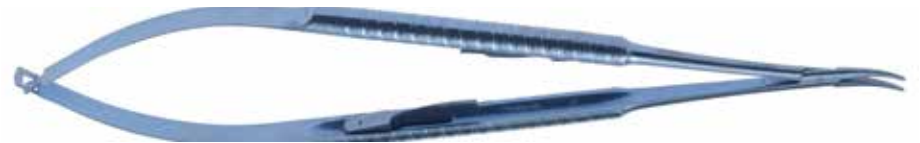
Micro-tijera curva de titanio, cuya punta lisa y precisa permite el acceso a espacios muy pequeños.