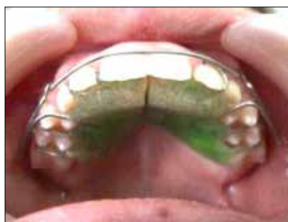
Figura 21. Placa Activa Tipo Artureitor-Margolis-Cetlin.