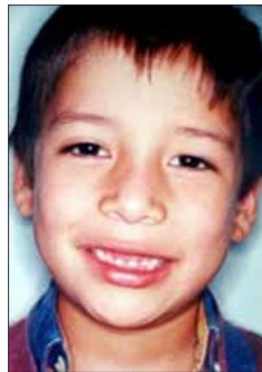
Figura 15. Postura.

El paciente tuvo tendencia a la recidiva por hábito de chupeteo del labio y aprendimos que cambiar la forma del arco de cuadrada a oval no es siempre conveniente en pacientes mestizos. Los Sistemas Trainers y Myobrace tienen forma oval y fueron diseñados para pacientes anglosajones, por lo que solicitamos al Dr. Farell un aparato con la forma del arco cuadrada y pantallas vestibulares