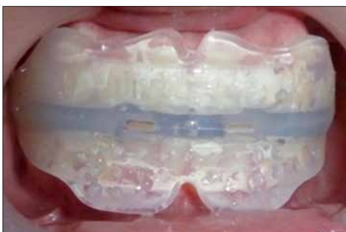
Figura 37. Myobrace A 1.