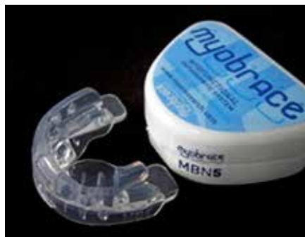
Figura 32. Los Myobrace MB y MBN vienen en siete medidas diferentes.