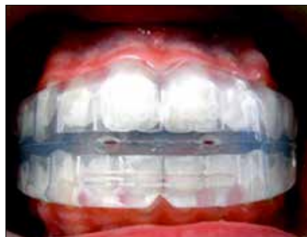
Figura 31. Myobrace MBN sin base interna dinámica: Ortodoncia sin brackets.