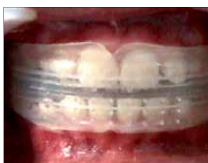
Figura 23. Trainer T4B, una hora al día y al dormir.