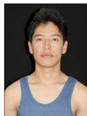
Figura 36. Arcada cuadrada.