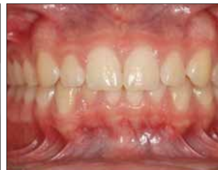
Figura 33. Oclusión a los 17 años.