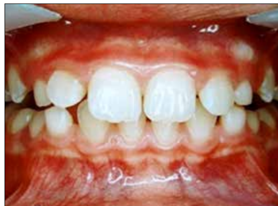
Figura 19. Avance en la corrección esquelética de la Clase II 2 a II-1. Nótese la mejoría del desarrollo vertical