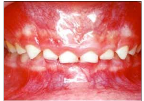
Figura 16. Mordida profunda.