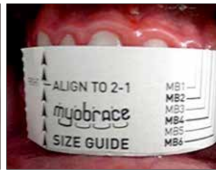
Figura 30. Guía para medir de canino a canino los Myobrace MB y MBN.