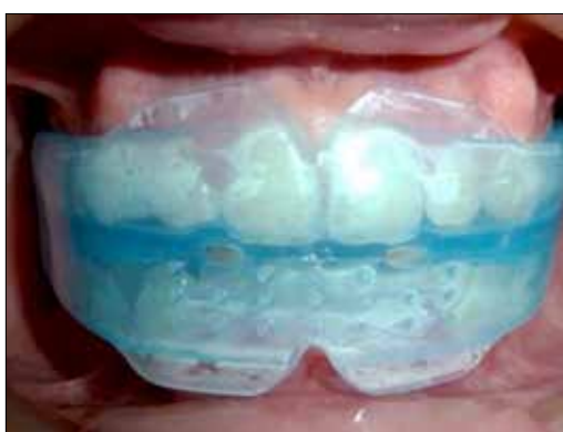
Figura 34. Trainer T4K Broad.