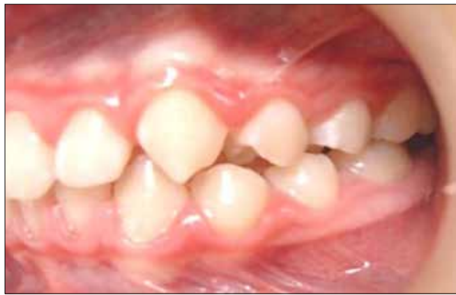
Figura 26. Avance mandibular Clase II canino. Clase I molar.