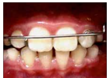
Figura 22. Avance mandibular levante de la mordida.