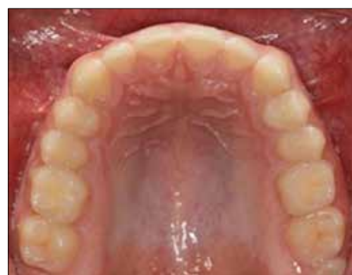
Figura 35. Paciente a los 17 años.