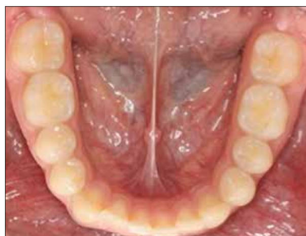
Figura 38. Arcada cuadrada.