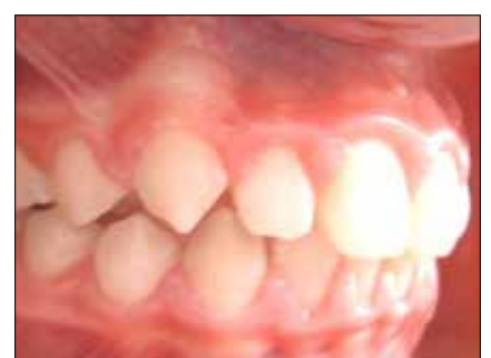
Figura 24. Avance mandibular Clase I molar y canino.