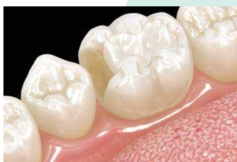
Restauration indirecte en céramique vitreuse, zircone, alumine et matériau hybride (ex : Cerasmart)