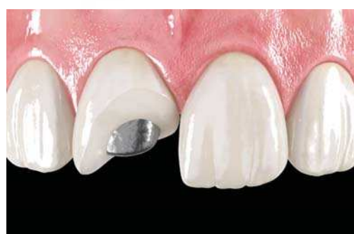
Restauration indirecte à base de métal (précieux et non précieux)