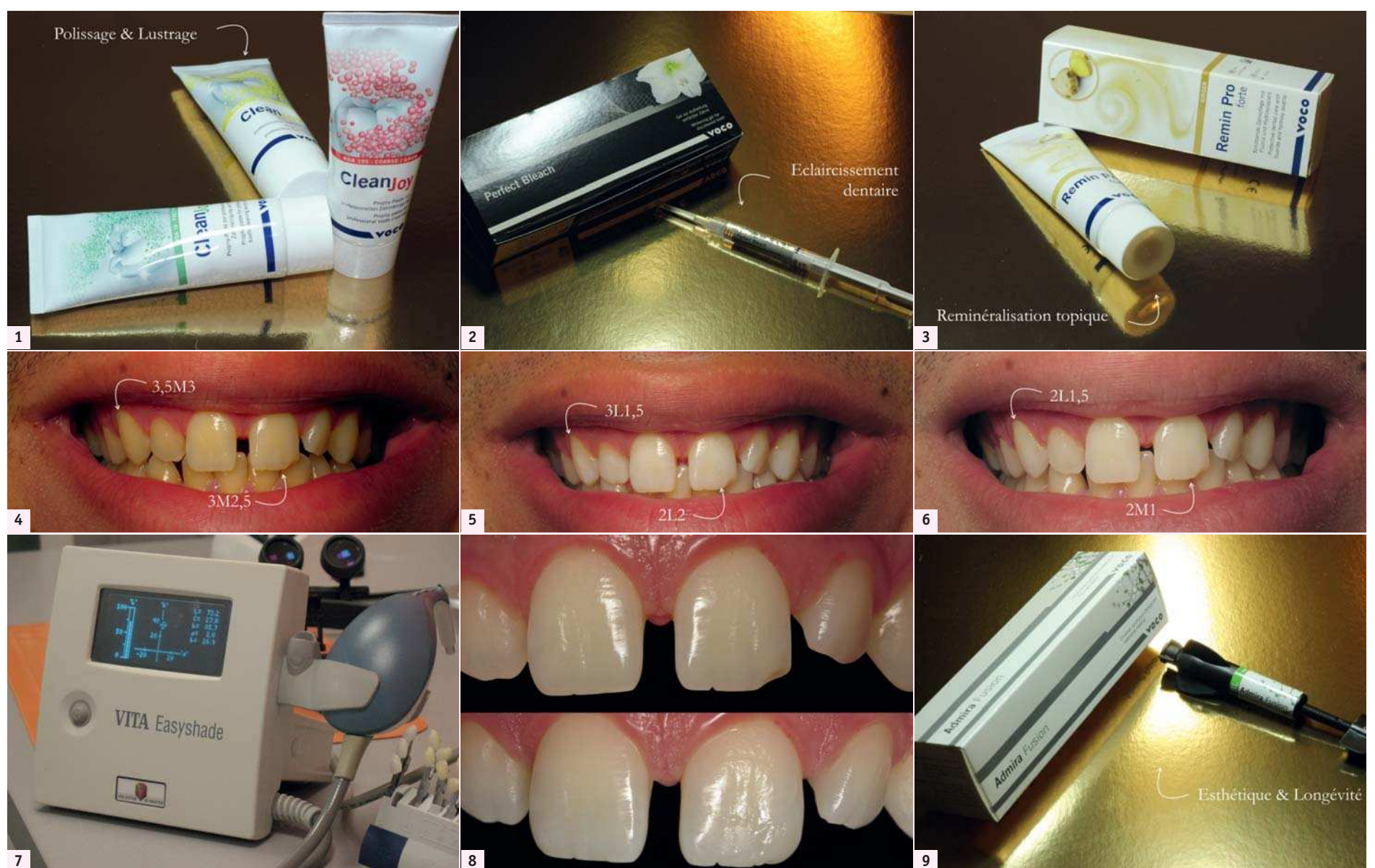
Fig. 1 : Pâte prophylactique CleanJoy. | Fig. 2 : Seringue de gel d'éclaircissement dentaire Perfect Bleach. | Fig. 3 : Produit de reminéralisation topique Remin Pro forte. | Fig. 4 : Sourire du patient à J0. | Fig. 5 : Sourire du patient à J14. | Fig. 6 : Sourire du patient à J35. | Fig. 7 : Spectrophotomètre Easysshade. | Fig. 8 : Adjonction de composite sur l'angle distal de 21. | Fig. 9 : Composite Admira Fusion en teinte Bleach Light.

Du point de vue du patient, le protocole a été suivi scrupuleusement sans erreur ou oubli. Les gouttières étaient confortables et n'ont pas occasionné de blessure. Il n'y a pas eu de fuite de produit en bouche, et l'éclaircissement dentaire n'a pas occasionné de douleur ou de sensibilité thermique. Le résultat obtenu était très satisfai-