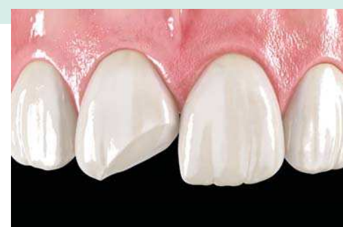
Restauration composite directe et indirecte

Gradia +, indications : composite pour restaurations indirectes.