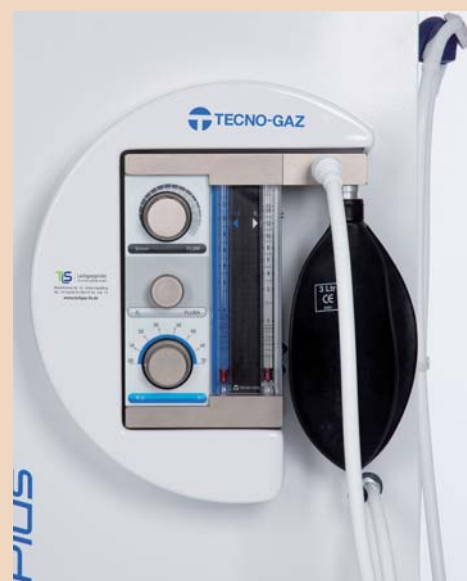
Lachgasgerät (ohne Zubehör).

Was sagen Ihre Patienten nach den Eingriffen unter Sedierung?