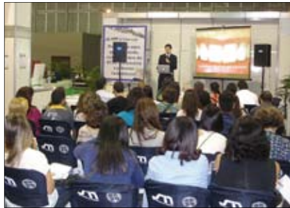
DTSC lecture at CIORJ Congress in Rio de Janeiro. Conferencia del DTSC en el congreso CIORJ, Río de Janeiro.

Dental Tribune Study Club (DTSC), the educational arm of DTI, provides Continuing Education ADA-CERP training courses live at congresses as well as online CE courses on a regular basis. Online CE courses are provided in various languages at DTSC's web page. On September 28 Dr. Edgar García Hurtado will offer a free Spanish-language online lecture entitled "New alternatives to direct restorations using nanoparticle resins in indirect techniques." The new issue of Dental Tribune Hispanic and Latin America publishes an interview on the topic with Dr. García Hurtado (read the article online at www.oemus.com/epaper/dti/4e37b785bfeb3 ). Many DTSC online courses are free. DTSC also presents live educational symposia at major international dental meetings and exhibitions such as IDS, Greater New York Dental Meeting, Moscow, Dubai, etc. Access to the DTSC Symposia in Mexico is free and the live lectures are recorded and archived in the digital library of the educational page so those who could not attend can watch the lectures at their convenience from their clinic or home 24/7. At the FDI World Congress in Mexico