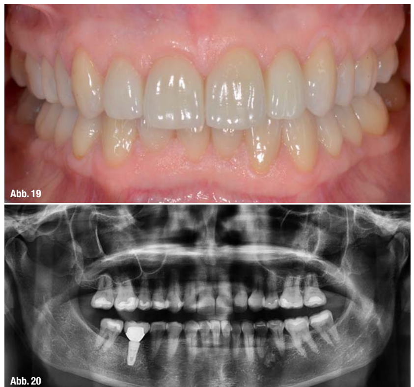
Abb. 19 und 20 Endergebnis nach 1,5 Jahren.

Abb. 18 Vor Eingliederung der Zähne 45–47; 46 Hybridabutment.