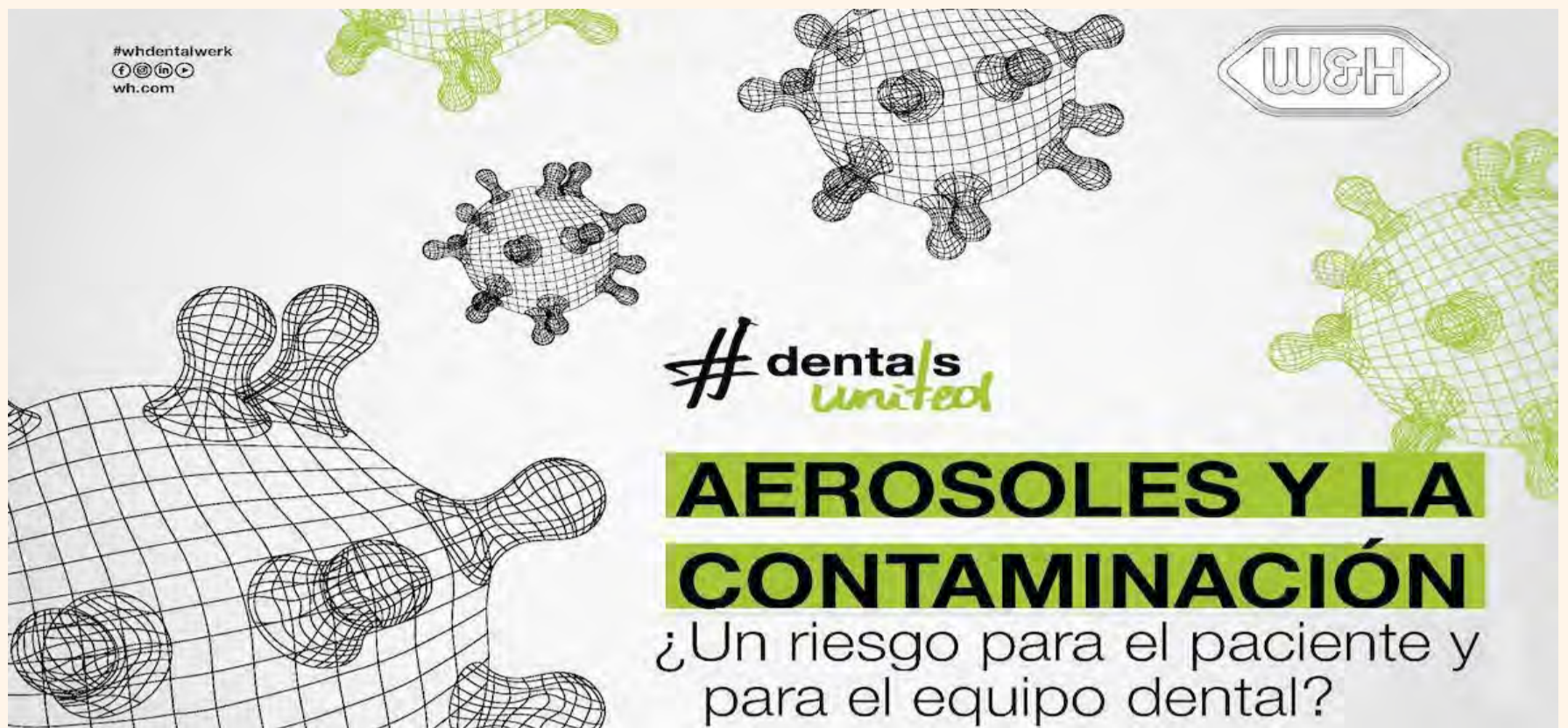
El folleto de W&H explica que varios estudios han demostrado la eficacia de utilizar enjuagues bucales antes de la intervención dental para reducir o incluso eliminar el SARS-CoV-2.

La publicación de W&H, titulada "Aerosoles y contaminación: ¿Un riesgo para el paciente y para el equipo dental?" ha sido realizada a partir del análisis de los comentarios de los profesionales de la odontología sobre sus principales preocupaciones.