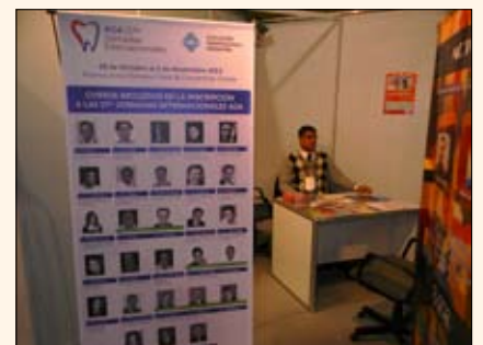
El stand de la Asociación Odontológica Argentina en Expodent Buenos Aires 2012.