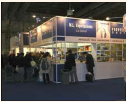
Uno de los concurridos stands durante la feria de Buenos Aires.

con luz LED incorporada, para el cual está buscando distribuidores en todo el continente.