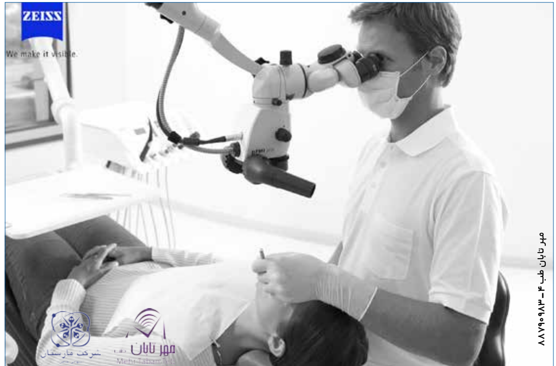
مهر تابان طب ۴ - ۹۸۳۰۹۸۷۹

OPTICGLAZE Color، گلیرزنگی نانوفیلید لایت کیورمی باشد که با بهره گیری از تکنولوژی Dispersed و هموزن کردن نانوفیلرها، جهت ایجاد پوششی براق و زیبا بر روی رستوریشن ها تولید شده. و این امکان را به دندان پزشک و تکنسین دندان می دهد که در حداقل زمان ترمیم و پروتزی زیبا با شفافیت و Shade دلخواهی که مورد پسند بیمار می باشد را تامین کند. در OPTICGLAZE Color با Nano-Filler Technology ترمیم هایی با مقاومت سایشی بالا (High Wear Resistance) و حداقل تغییر رنگ در طول زمان را ایجاد کرده اند و با در نظر گرفتن خواصی همچون، باندینگ بسیار محکم و بادوام، ایجاد پوشش براق، ضخامت لایه ای بین 25-50 μm و کاربرد آسان و سریع، در مطب و لابراتوار سبب شده تا تطبیق پذیری عالی همراه با کاربرد های گسترده ای جهت ایجاد پوششی براق، زیبا و محافظت کننده در زمینه های: روکش های موقت، روکش های سرامیکی هیبرید، اوردنچرهای متکی بر ایمپلنت، بیس دنچرهای آکریلی، پلاک های متحرک و دندان های مصنوعی، رستوریشن های آکریلی Indirect و تری های آکریلی تک دندانی، رستوریشن های کامپوزیتی Indirect (در نواحی اینترپروگزیمالی و شیارهای خلفی) بدست آورد شود.