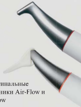
> Оригинальные наконечники Air-Flow и Perio-Flow

Эффективное удаление биопленки в глубоких пародонтальных карманах. Это сущность Оригинальной Технологии Air-Flow Perio. Сокращение уровня поддесневых бактерий предотвращает потерю зуба (пародонтит) или потерю имплантата (периимплантит). Равномерный турбулентный поток воздушно-порошковой смеси и воды предотвращает эмфизему мягких тканей, даже за пределами традиционной области профилактики, благодаря действию носика Perio-Flow.