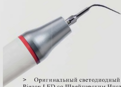
> Оригинальный светодиодный наконечник Piezon LED со Швейцарским Инструментом PS

Практически, безболезненный для пациентов и особо мягко воздействует на десневой эпителий: максимальный комфорт пациента – это определенный плюс, который предлагает передовая Оригинальная Технология Piezon. Не говоря уже о исключительно гладкой поверхности зубов после применения Piezon. Эти особые преимущества являются результатом линейных колебаний, направленных параллельно поверхности зуба, создаваемых Оригинальными Швейцарскими Инструментами EMS, которые идеально подходят к новому