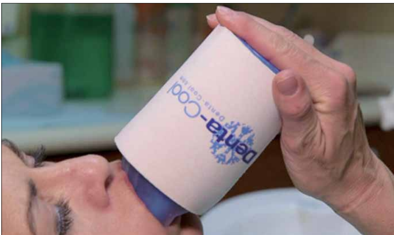
Denta Cool最近为牙科患者发布了一种非处方口内止痛剂，可有效替代阿片类药物或冰袋。

根据各种研究，尽管通常认为阿片类药物的使用是安全的，但长期使用该类物质且剂量高于最初处方的患者可能会发展成阿片类药物成瘾、药物过量甚至死亡。美国国家药物滥用研究所报告说，1999年至2017年，在美国，涉及类阿片的药物过量死亡人数增加了6