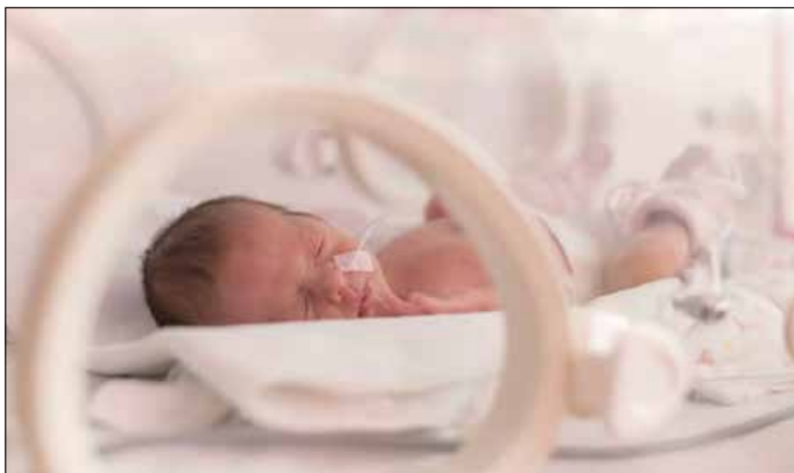
最近一项研究表明，患牙周病的孕妇更有可能出现早产。

该研究发表在2019年2月出版的《临床牙周病学杂志》上，标题为“牙周疾病与早产之间的关系”。