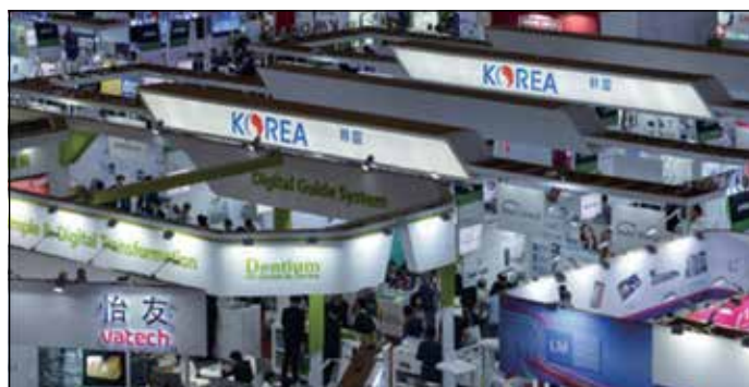
DenTech China 2018展会现场图。

本届展会将有德国国家展团、美国国家展团、韩国国家展团、中国台湾地区展团、意大利国家展团、中国佛山地区展团盛装亮相。来自海内外的先进技术、高端产品及行业专业解决方案，将一一在展会现场呈现。