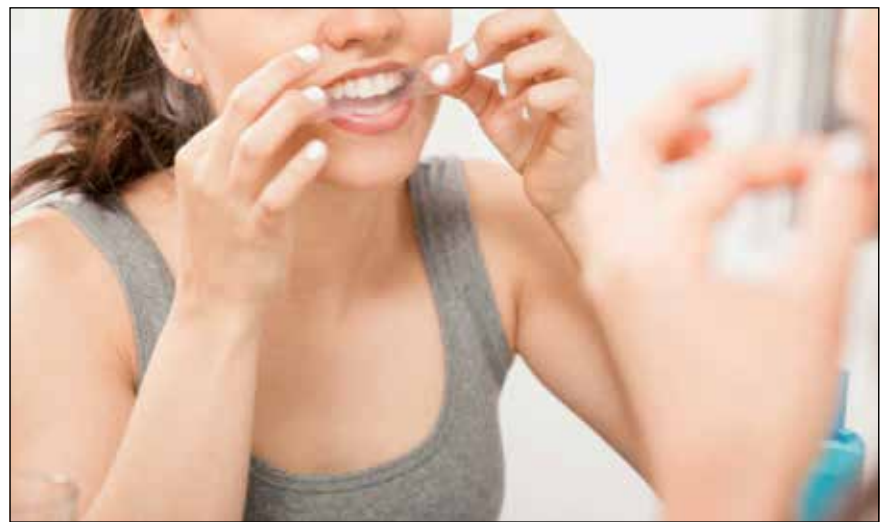
研究人员发现，在美白牙膏中发现的某种活性成分可能会损害富含蛋白质的牙齿层。

本项研究的总结于2019年4月6日至4月10日在奥兰多美国生物化学和分子生物学学会的年会上发表。