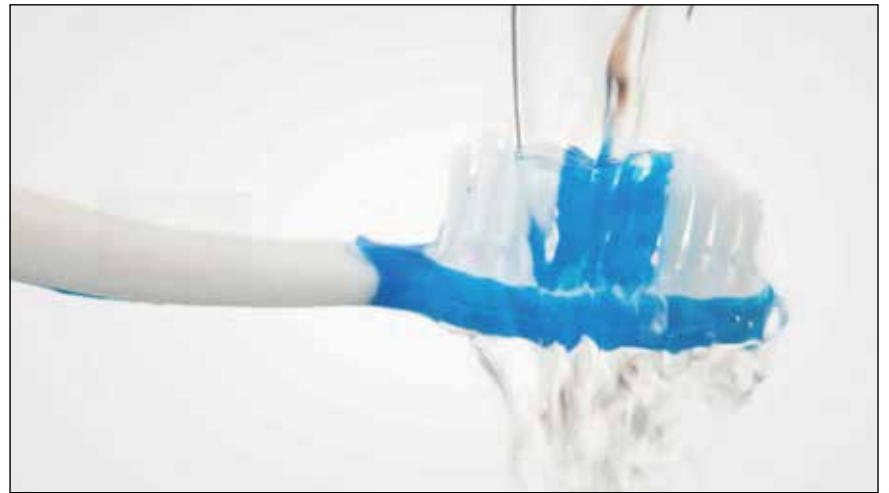
最近的一项研究发现，怀孕期间摄入氟化物可能会影响孩子的智商。

《美国医学会儿科杂志》上，标题为“加拿大孕期母亲摄入氟化物与其后代IQ得分之间的关系”。