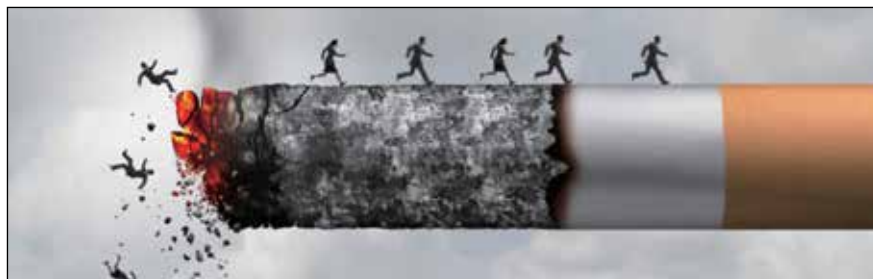
美国国会议员最近提出了一项旨在解决年轻人尼古丁上瘾问题的法案。

在一封写给参议院多数党领袖Mitch McConnell和参议员Tim Kaine的信中，联盟称赞议员们引入了《无烟青年法》。“你们都知道，这项立法将使购买烟草制品的法定年龄从18岁增加到21岁，这对于解决我们目前的青少年吸烟率至关重要，”ODC写道。“90%死于