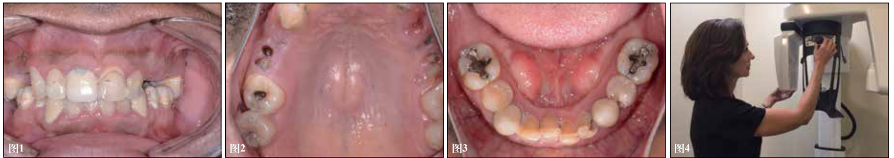
图1: 治疗前正面照。图2: 治疗前上颌合面照。图3: 治疗前正面照。图4: CS 8100 3D。

当患者来到您的诊所要求进行修复,但检查后发现所有牙齿都无法保留需要拔除时,最大的问题便是在拔牙同时能不能进行同期种植体的植入,以及如果可以进行即刻种植,那么患者是否能够戴着临时义齿离开诊所。如果您的诊所拥有这样一个种植系统,可以即刻负重或者逐步负重以满足这些患者的需求,就可以让诊所提高一个档次达到一个全新的技术水平。当然,为了方便这种类型的治疗,必须满足一些条件。包括骨量和骨密度,是否存在感染,病人的全身健康和牙科医生的技术水平。此外,必须满足最理想的条件并选择最合适的材料。