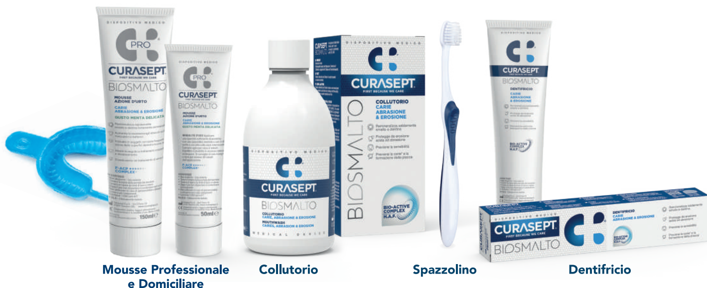
Mousse Professionale e Domiciliare

AUTORI: Ionescu Ac., Izzo D., Pulcini MG., Dian A., Brambilla E. Università degli Studi di Milano, Laboratorio di Microbiologia Orale e Biomateriali. IRCCS Istituto Ortopedico Galeazzi, Clinica Odontoiatrica. Collegio dei Docenti, Napoli. 2019. Codice Poster MAT05. Journal of Osseointegration 2019.