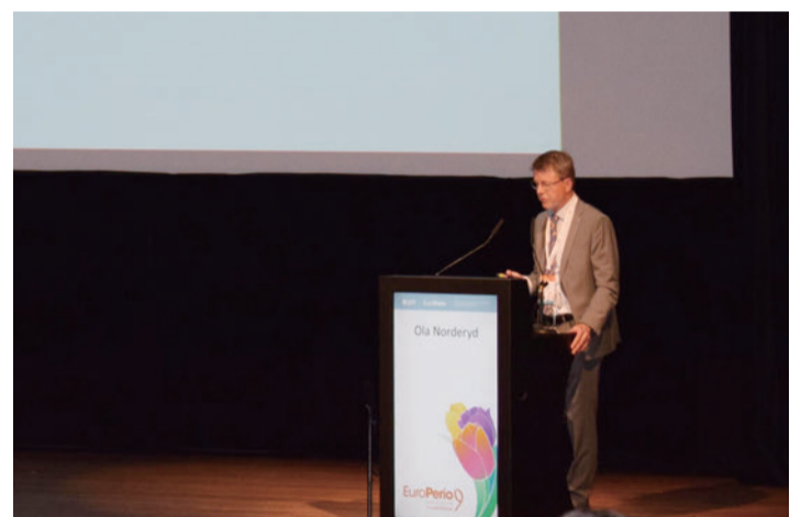
歯周病とインプラント周囲炎がもたらす真の影響とは何かを語ったDr. Ola Norderyd

歯周病は、世界中で約7億4,300万人が罹患し、世界で6番目に多い疾患となり、年間540億ドルの損失をもたらすとみられている。歯周病の有病率は年齢とともに上昇するため、高齢化の進行で世界的な疾病負担が増加する可能性が