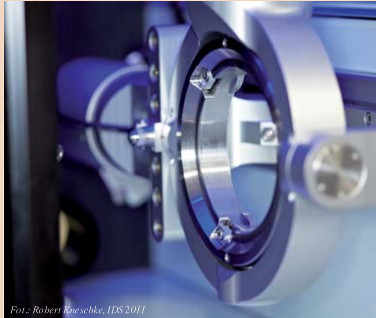
Fot.: Robert Kneschke, IDS 2011

W gabinetach stomatologicznych znajdziemy tytanowe implanty ze specjalną powłoką z patentem NASA, która przyspiesza gojenie się i zrastanie implantu z kością szczęki. Dzięki temu dentyści są w stanie odbudować przy pomocy 4 implantów pełne uzębienie, nawet w 24 godz. albo podczas jednej wizyty wstawić pojedynczy ząb. Opracowano także i przebadano implanty o długości zaledwie