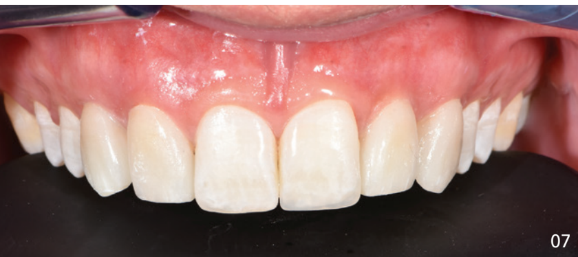
07 und 08 Endergebnis nach der Behandlung.