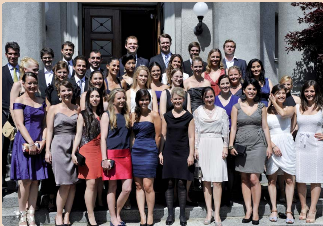
Geschafft: 27 Diplomandinnen und 7 Diplomanden vor der Kirche Fluntern, Zürich.

reichte die Diplome. Er bedankte sich bei den Lehrenden für ihr Engagement, junge Menschen auf den Beruf des Zahnarztes vorzubereiten, und bei den Lernenden für ihre Disziplin.