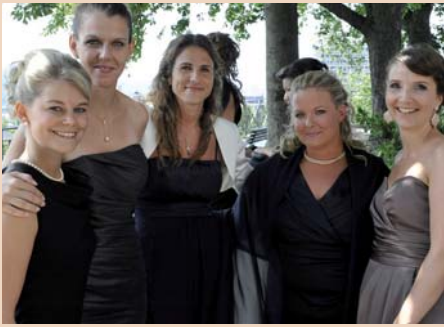
Vorfreude ist die schönste Freude: Gleich beginnt die Diplomfeier.