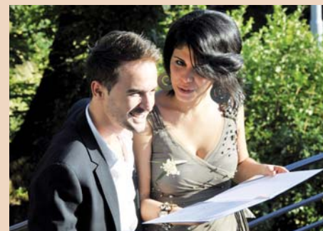
Hier steht's „schwarz auf weiss“: Ich bin jetzt Zahnärztin.