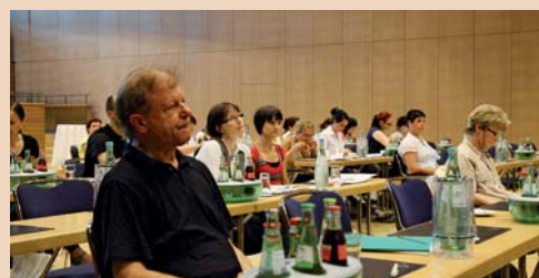
Alles rund um gingivale Rezessionen erfahren Teilnehmer an der GABA-Roadshow.

Termin in Basel im November/Fotos aus DE-Dresden sind ab sofort online.