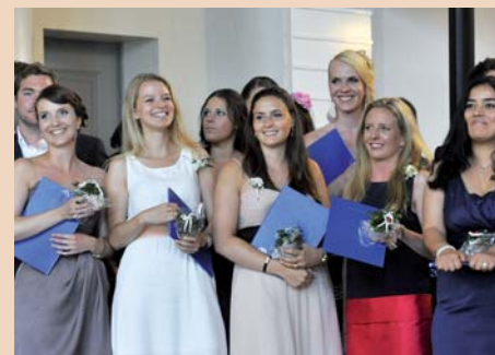
Freude und Stolz steht den Diplomandinnen ins Gesicht geschrieben.