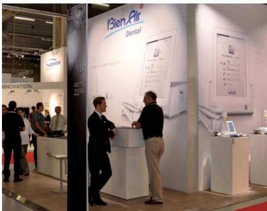
Instrumente von Bien Air für Praxis, Labor und Chirurgie. www.bienair.ch