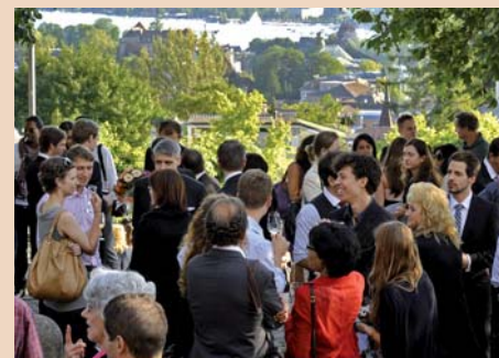
Diplomanden, Familien, Freunde, Dozenten und Instruktoren lassen beim Apéro den Nachmittag ausklingen.