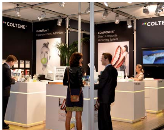
Coltene steht für Verbrauchsmaterial, Instrumente und Klein-geräte. www.coltene.com