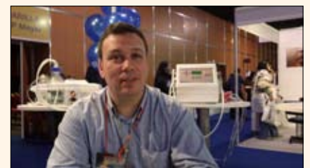
El director de la compañía GO3 explicó las propiedades del dispositivo de ozono GO3 Advance.