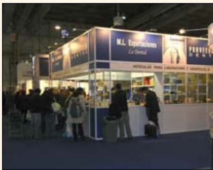
Uno de los concurridos stands durante la feria de Buenos Aires.

con luz LED incorporada, para el cual está buscando distribuidores en todo el continente.