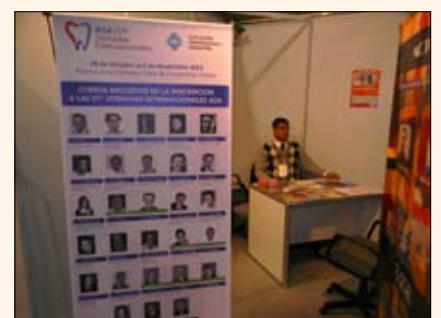
El stand de la Asociación Odontológica Argentina en Expodent Buenos Aires 2012.