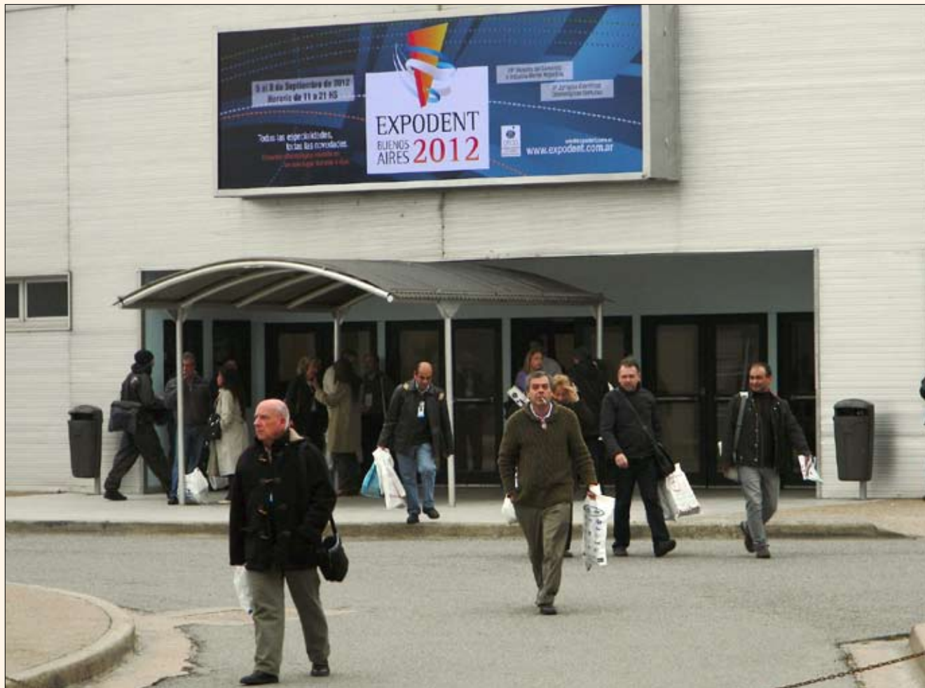
La entrada a Expodent Buenos Aires 2012 en el Centro Costa Salguero.