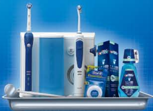
专业种植口腔护理计划