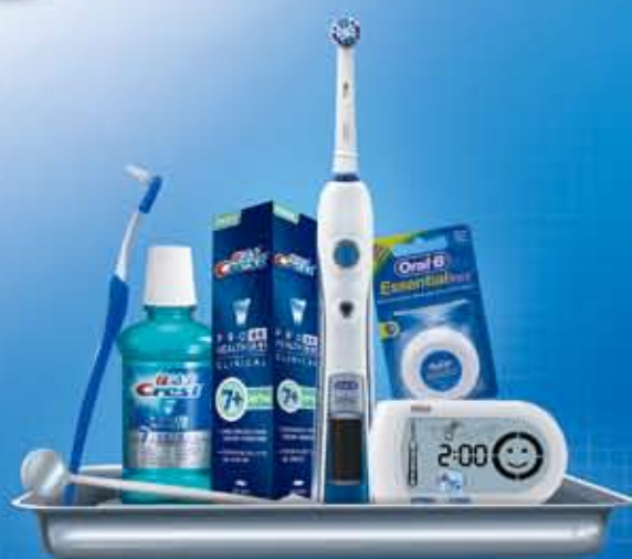
专业正畸口腔护理计划