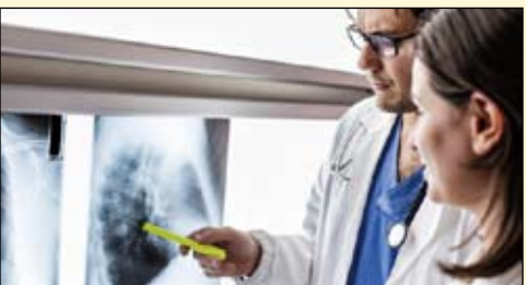
肺癌的死亡率在癌症疾病当中居于首位，全球每年有约160万人死于肺癌。

来自美国洛杉矶的牙科研究人员近日开发出了一种用以在唾液中检测肺癌基因突变的新方法。他们发现，使用这种唾液检测法检测肺癌的成功率与血液检测法一致。这种全新的唾液检测法由于其无创性、低成本以及速度快的特点有望成为检测肺癌的另一种可行方法。