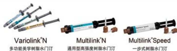
Variolink N 多功能美学树脂水门汀 Multilink N 通用型高强度树脂水门汀 Multilink Speed 一步式树脂水门汀

官方微信 ivoclar vivadent passion vision innovation 义获嘉伟瓦登特公司