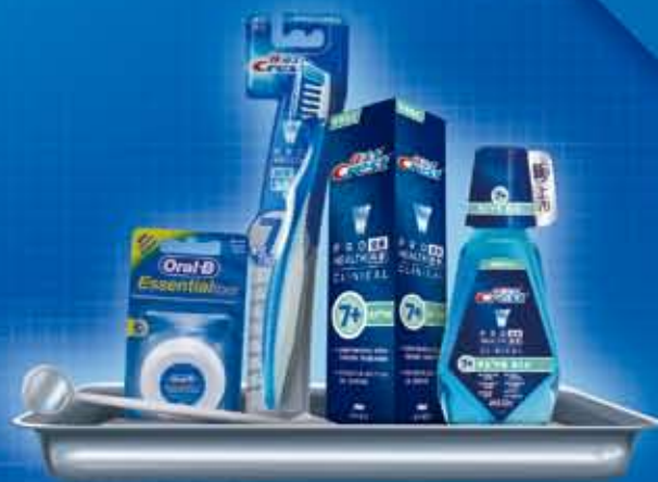
专业牙周口腔护理计划