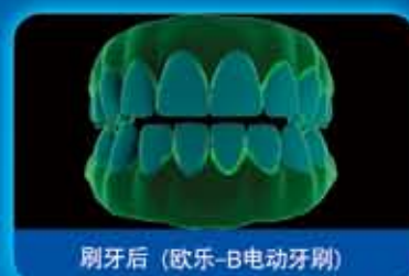
刷牙后 (欧乐-B电动牙刷)