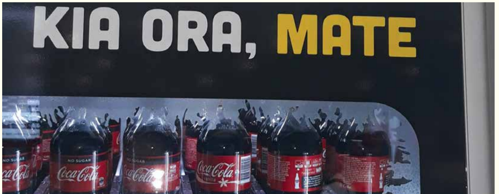
Marketinški trik Coca-Cole, kroz kulturološko prisvajanje te reo Maori (Maori jezika), targetira Novozelance koji su izloženi riziku.

„Ova korporacija koja apsolutno ne brine za našu mokolupna (djecu), našu kuia (nenu) i kaumatua (starije) je uze-