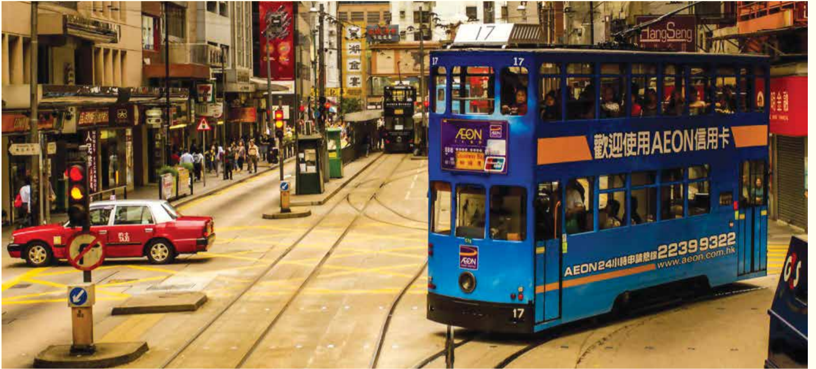
SmileDirectClub je dodao Kowloon