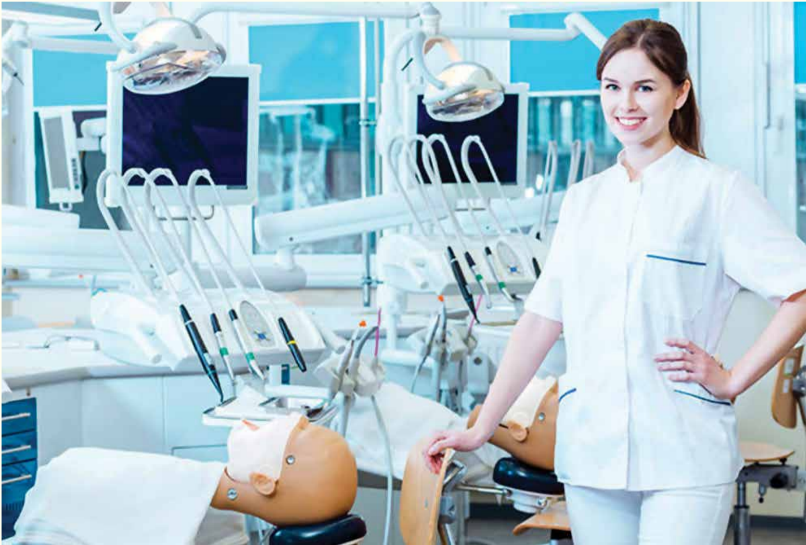
Kako se stomatološka industrija konstantno širi, tako se i povećava broj opcija za karijeru.

SIDNEJ, Australija: Najčešće se slike u vezi sa stomatologijom svode na stolicu u jednoj prostoriji, jaka svjetla i dva ili tri para očiju koje bulje u usta pacijenta. Međutim, kako se industrija razvija tako raste i broj opcija za karijeru. Nedavno objavljen članak sa Sidnej univerziteta govori o osoblju i alumnistima koji su izgradili interesantne karijere van kliničkog okruženja.