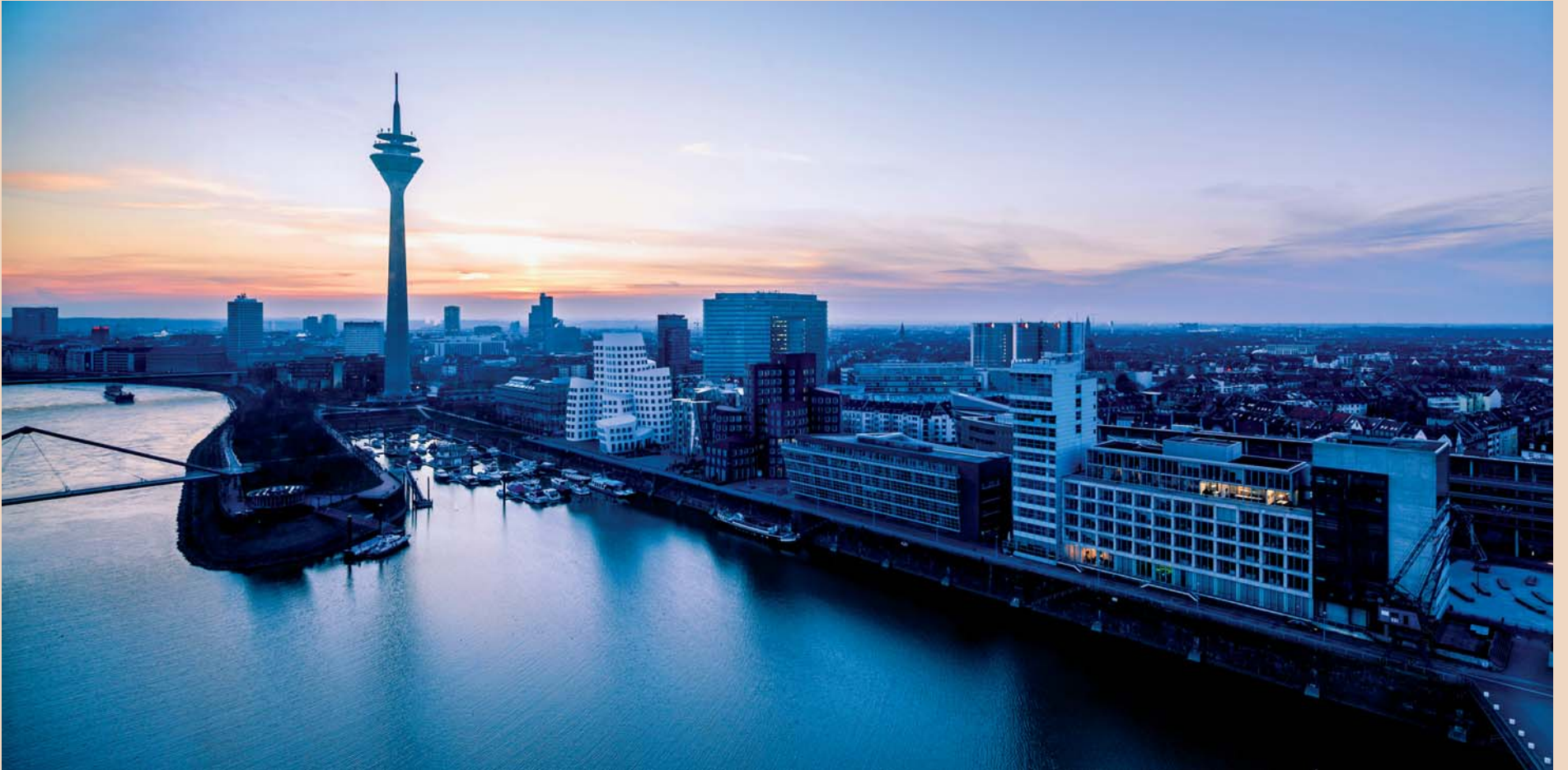
Am 26. und 27. September 2014 findet unter der Themenstellung „Mikroinvasiv – Minimalinvasiv: Integrative Lasertechnologie“ in Düsseldorf die internationale Jahrestagung der DGL statt.

angebotenen Dentallasern ist man in der Lage, alle etablierten Therapieeinsätze durchzuführen. Dass wir im Moment in Deutschland eine etwas