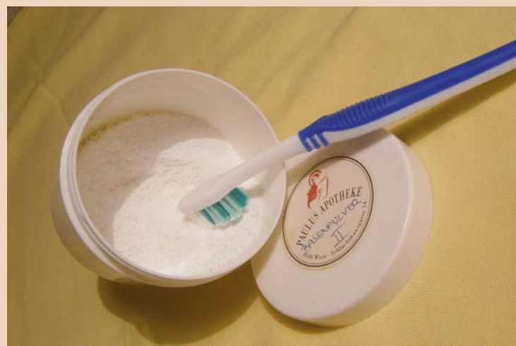
Putzen mit Soda.