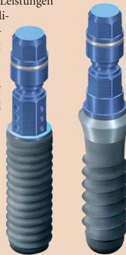
Alle Roxolid-Implantate werden mit dem neuen Loxim-Transferteil geliefert.

die Mehr-Marken-Strategie, die Straumann bereits mit der Marke Neodent umsetzt. Die Philosophie von Straumann, hervorragende Produkte und Lösungen anzubieten, deren klinische Erfolgsnachweise dokumentiert sind und die durch ausgezeichnete Dienstleistungen ergänzt werden, bleibt bestehen.