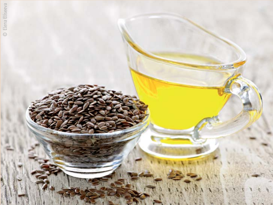
Leinsamen und Leinöl.