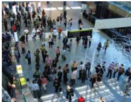
• Participants se pressant près de l'entrée de la salle d'exposition. • Attendees gather near the entrance to the exhibit hall.