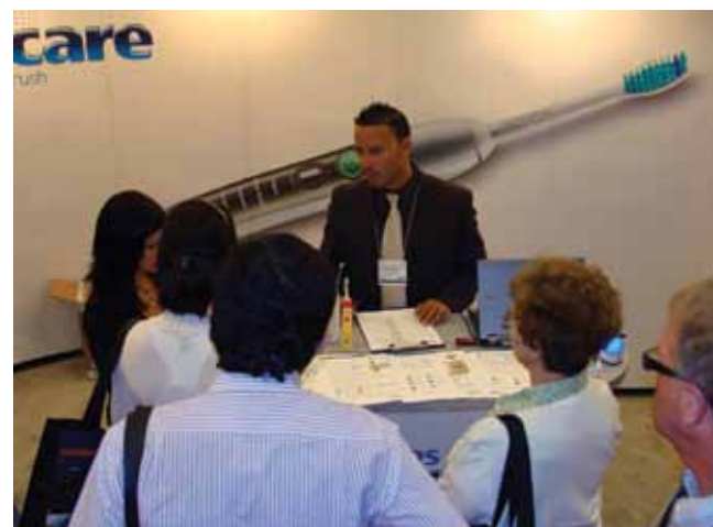
· Le kiosque de Philips Sonicare (no. 2115). · The Philips Sonicare booth (No. 2115).