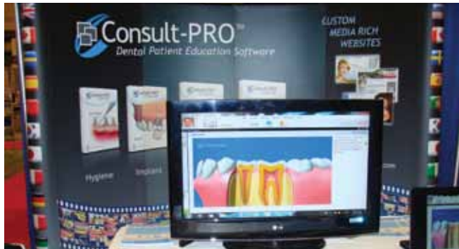
• Des outils éducatifs pour les patients sont offerts au kiosque de Consult-Pro (no. 1511) • Patient education tools are on display at the Consult-PRO booth (No. 1511).