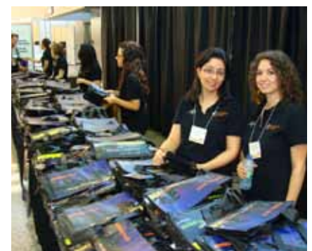
• Assurez-vous de prendre un sac au kiosque d'enregistrement. • Make sure to pick up a bag in the registration area.