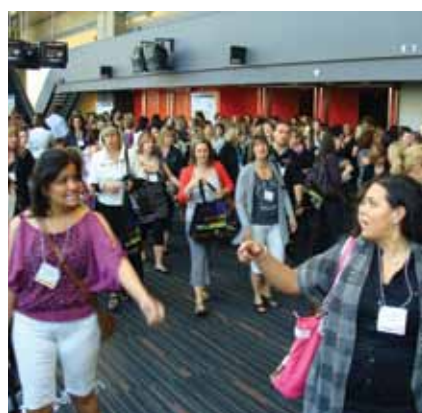
· Les participants sortant d'une session éducative. · Attendees file out after an educational session.