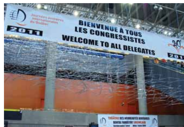
· Les JDIQ accueille les participants en français et en anglais. · The JDIQ welcomes attendees in English and French.