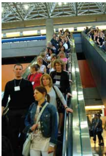
• Vous descendez ou vous montez? L'éducation c'est en haut, les exposants, en bas. • Going down or going up? Education is up, exhibits are down.