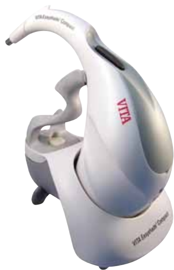
• Easyshade Compact de Vita. • The VITA Easyshade Compact.

produits dentaires depuis 1985 et est la filiale Nord Américaine de la compagnie Vita, fabricant des jeux de teintes Classical, Système Master 3D, l'appareil numérique de mesure des teintes Easyshade Compact et des matériaux de restauration Vita, qui sont reconnus mondialement.