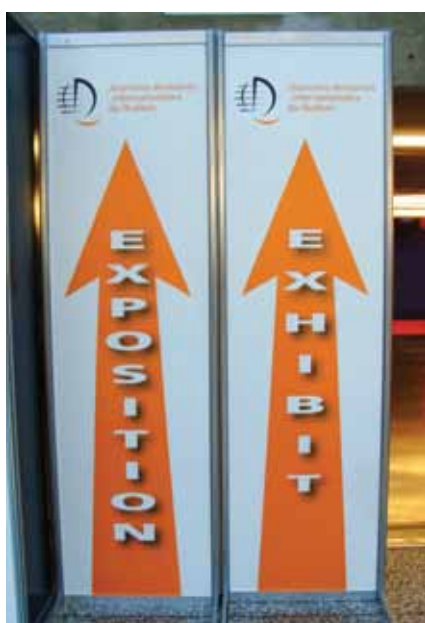
· Par ici vers le plancher de l'exposition. · This way to the show floor.