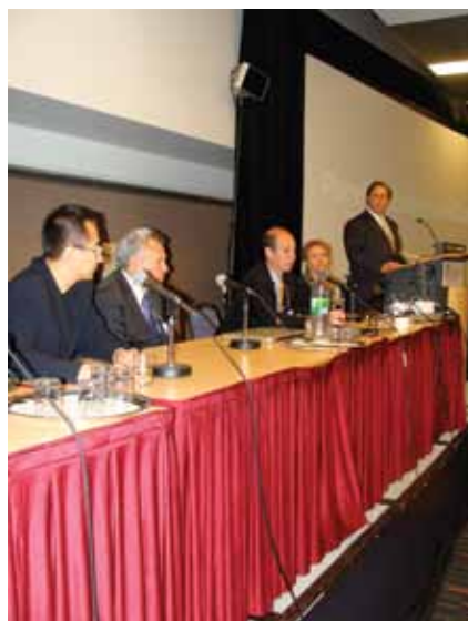
· Un invité expert discute des mythes et réalités de l'implantologie dentaire devant une salle bondée de participants pendant une session éducative lundi matin. · An expert panel discusses the myths and realities of implant dentistry during a standing-room-only educational session Monday morning.