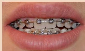
Ein 15-jähriges Mädchen mit Multiband-Multibracket-Apparaturen im Oberkiefer.