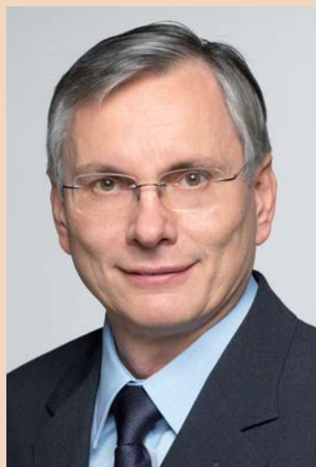
Gesundheitsminister Alois Stöger

KREMS – Bei der Suche nach einem Kompromiss im schwarz-roten Steuerstreit gelang es Gesundheitsminister Alois Stöger, seine im Nationalratswahlkampf auf der Strecke gebliebene „Gratis-Zahnspange“ auf Staatskosten wieder auf den Tisch zu bringen. Sollten damals jährlich 150 Millionen Euro in die KFO-Behandlung für Kinder auf Kasse „fließen“, spricht er nun von 80 Millionen zusätzlich zu bisher 30 Millionen für 85.000 Patienten, setzt aber zur bisher geplanten Einführung Mitte 2015 nur 20 Millionen als Ausgabenrahmen ins Budget. Hintergrund dafür scheint zu sein, dass der Hauptverband gemeinsam mit Stöger versuchen will, nur 10% der Fehlstellungen, also der IOTN-Stufe 5, in den Gratis-Zahnspangen-Plan einzubeziehen und außerdem die zahnärztlichen Honorare für die Behandlung zu drücken. Für die Finanzierung sollen nach Regierungsbeschluss bisher für die Belegung der Konjunktur vorgesehene Offensivmittel herangezogen werden.