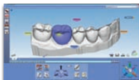
Planmeca PlanScan™ Planmeca PlanScan™ Lab