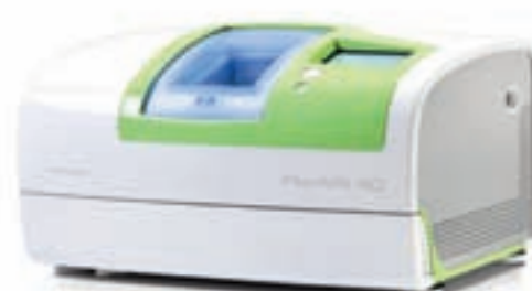
Planmeca PlanMill™ 40 Planmeca PlanMill™ 50 PlanEasyMill™