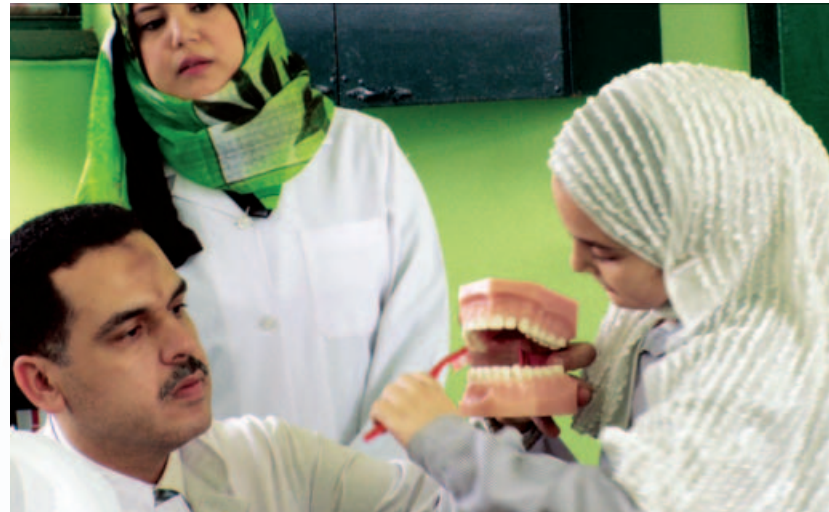
Phase 1 Egyptian project showing children how to brush. Crianças do Egito aprendem a escovar os dentes corretamente.

U nilever Oral Care e da FDI World Dental Federation irá celebrar o lançamento da próxima fase de sua parceria global única, conhecida como Live.Learn.Laugh., em Congresso Mundial da FDI. Este lançamento irá continuar o sucesso da primeira fase, que aumentou a conscientização da importância da saúde bucal através