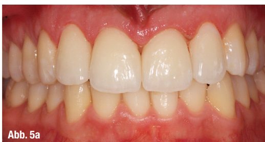
Abb. 5b–d: Zwei Monate nach Eingliederung – Frontalansicht, Lippenansicht, Nahaufnahme.