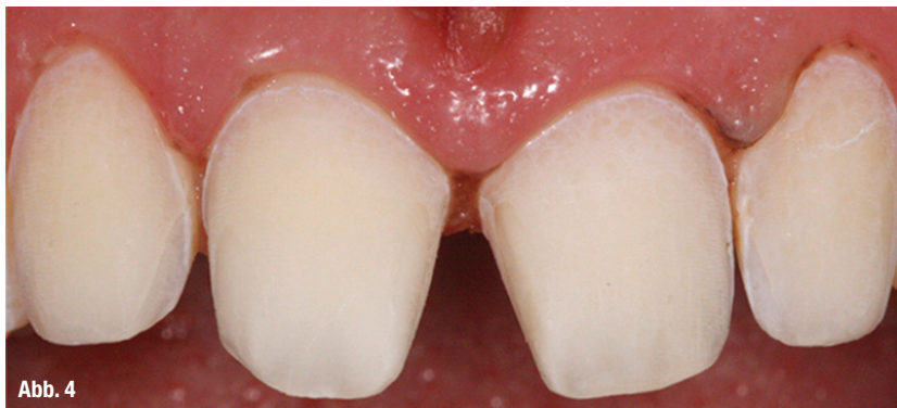
Abb. 4: Konditionierter Schmelz nach Verwendung von 37%igem Phosphorsäure-Gel.

Nach gründlichem Absprühen mit Wasser und Trocknen wurden die Keramikoberflächen mit einem Ein-Komponenten-Haftsilan (Monobond-S, Ivoclar Vivadent) bearbeitet. Die präparierten Zahnoberflächen wurden mit Polierkelch und Prophylaxepaste gereinigt und anschließend mit 37%iger Phosphorsäure für 60 Sekunden konditioniert (Abb. 4). Auf die präparierten Bereiche wurde anschließend das Adhäsivsystem Syntac (Ivoclar Vivadent) aufgetragen. Als definitives Befestigungskomposit diente Variolink Veneer (Ivoclar Vivadent). Es erfolgten regelmäßige Kontrollen inklusive einer abschließenden Fotodokumentation zwei Monate nach der definitiven Eingliederung (Abb. 5a–d).