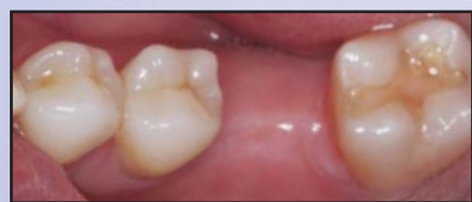
Edentulous area of tooth #19