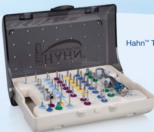
Hahn™ Tapered Implant Surgical Kit