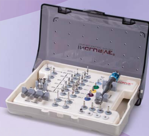
Inclusive® Tapered Implant Surgical Instrumentation Kit

Inclusive is a registered trademark of PrismaDent Dentalcraft, Inc.