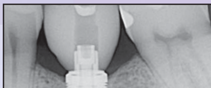
Six months after implant placement