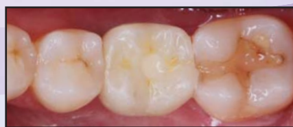
Delivery of final BruxZir® crown