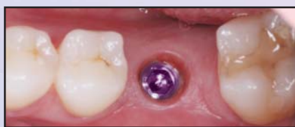
Implant three months post-placement