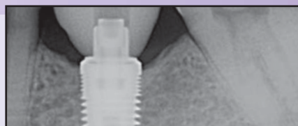
18 months post-placement