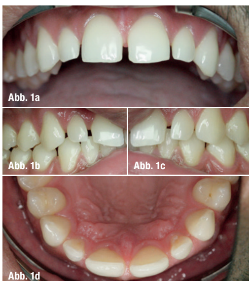
Abb. 1a–d: Ausgangssituation. Abb. 2: Ausgangssituation OPG.

Um dem Patienten eine Vorstellung über das mögliche Endergebnis zu eröffnen, wurden nach der