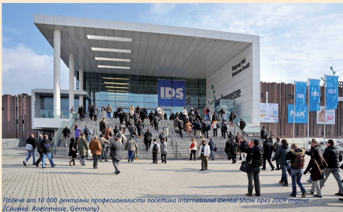
Повече от 10 000 дентални професионалисти посетиха International Dental Show през 2009 година.

Като цяло от Koelnmesse очакват на събитието да присъстват над 1800 дентални компании от 56 страни. Поради този интерес зала 2 ще бъде отворена за компании и посетители за първи път, казаха организаторите. Допълнителни запитвания за