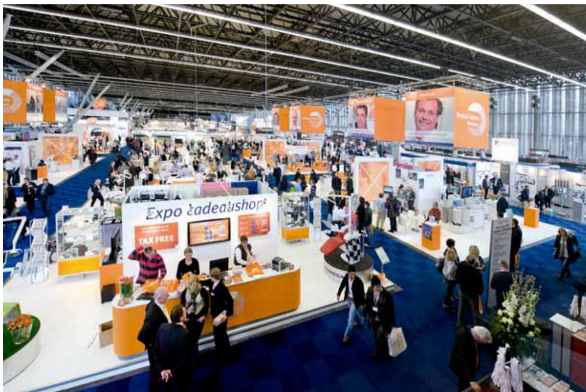
Dental Expo: druk bezocht en toch overzichtelijk.