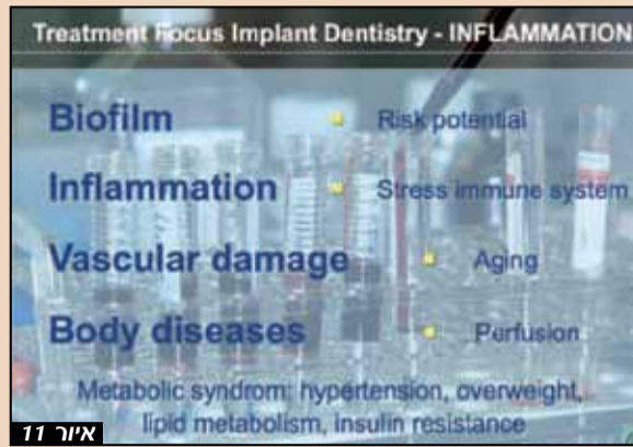
איור 11: טיפול חניכיים מוריד את הנטל דלקתי ומקדם בריאות תוך אופטימיזציה של חילוף חומרים בגוף עם גירוי השפעות על מערכת כלי הדם

סיכום במחלות חניכיים מתקדמות, התקשורת בין התקדמות הרפואה לבין ציפיות גבוהות של המטופלים דורשת לוח זמנים עם תקופת חסד של שלושה עד שישה חודשים על מנת להעריך את השפעת הטיפול הפרודונטלי על מערכת חניכיים-משן. אם מטופלים מצפים לפתרון שיקומי קבוע ואסתטי באופן מיידי, טיפול בשתל על הזמן עם פתרונות תומכים מינימליים מומלץ. שימור שיניים טבעיות מומלץ במקרים של מטופלים המוכנים לשתף פעולה למרות אי נוחות אסתטית ותפקודית. המשך טיפול פריו יכול להיות נתמך בפעולות כירורגיות מתקדמות על מנת להשיב יכולת שמירה על היגיינה. הצלחה ארוכת טווח