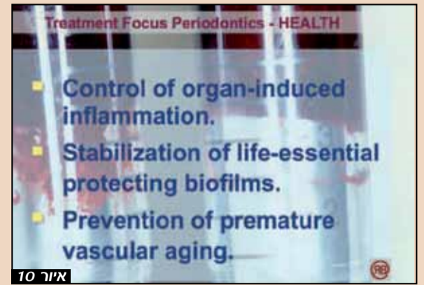
איור 10: שתלים דורשים טיפול תחזוקה מקיף. דלקות Perimplant להציג זיהומי גוף זרים, כי הם מזיקים יותר לבריאות הגוף מאשר מחלות חניכיים.