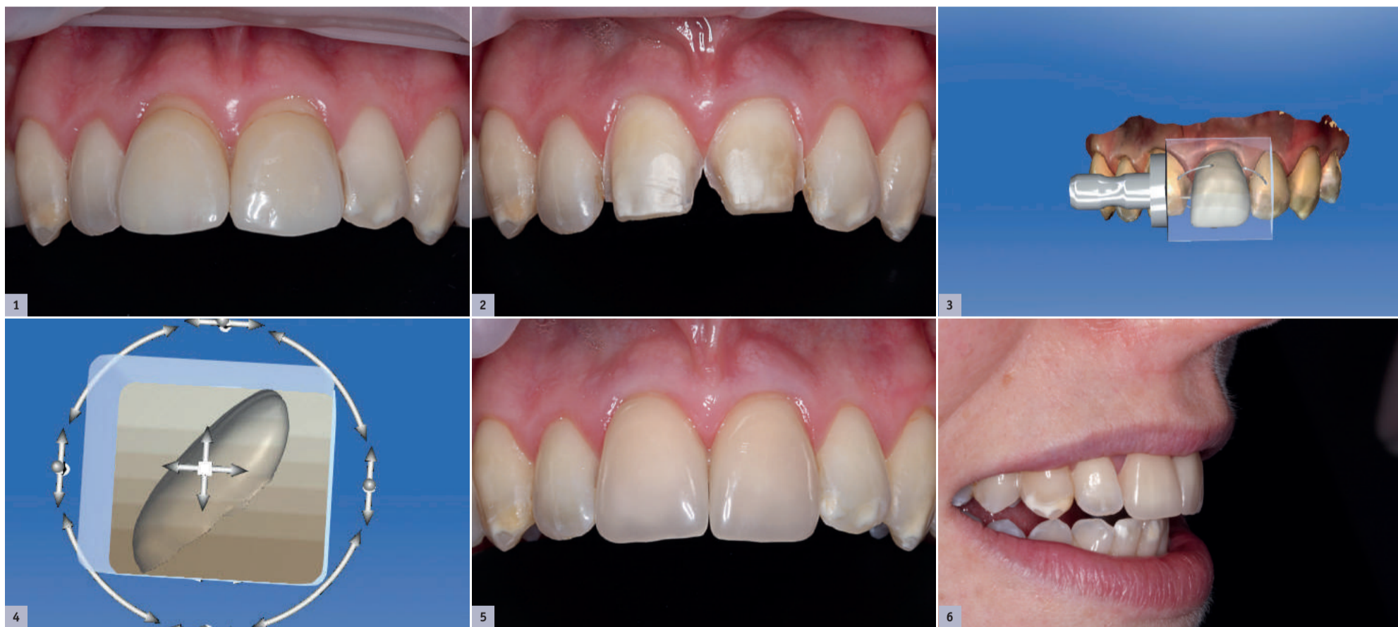
*Fig. 1: Situação inicial. *Fig. 2: Preparação. *Fig. 3: Posicionamento da construção na coroa. *Fig. 4: Rotação do design para um gradiente de sombra harmonioso. *Fig. 5: Situação imediatamente após a integração. *Fig. 6: As coroas VITA ENAMIC multiColor têm um aspecto natural in situ. Depois de observar os resultados positivos, o paciente solicitou a restauração dos dentes restantes.