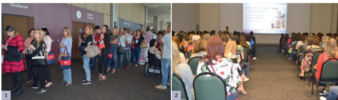
*Imagem 1: O tema estética atrai profissionais do Brasil e do Exterior em busca de atualização na área. *Imagem 2: Odontologia e Gestaçao: especialista destacou a importância do pré-natal odontológico.

Com o tema “Ciência e clínica: combinação perfeita”, a 36ª edição do CIOSP registrou um grande número de participantes, que vieram ao Expocenter Norte conferir as novidades tecnológicas da feira comercial e os cursos e palestras oferecidos para quem busca formação profissional. Somam-se a isso as pesquisas apresentadas durante o evento, que representaram um painel do que há de mais inovador em termos de estudos acadêmicos sobre a Odontologia no Brasil e no Exterior. Outro grande destaque foram os importantes debates oferecidos para quem se interessa por discutir as questões políticas e sociais que envolvem a