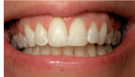
After Six Month Smiles

Six Month Smiles is a cosmetic, minimally invasive system to straighten your adult patients' teeth in about six months.