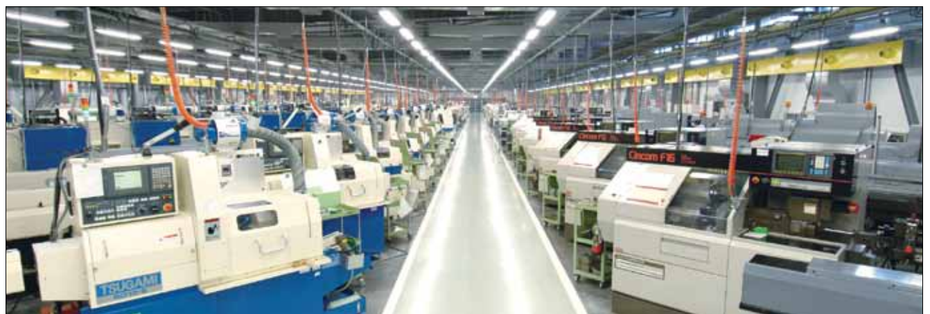
· NSK fabrique toujours la majorité des pièces de précision à l'interne. · NSK still manufactures most of the precision parts in-house.