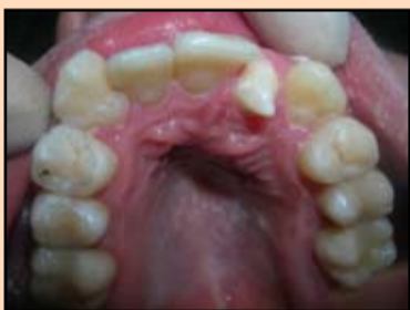
Slika 1. Lokalna hipoplazija gleđi 2.2, kljunast oblik zuba

U svom svakodnevnom radu praktičari lekari-stomatolozi često se susreću sa bolestima tvrdih tkiva zuba nekarioznog porekla. Različiti poremećaji u periodu folikularnog razvoja zuba dovode do formiranja nedostataka tvrdih tkiva koje prvo otkriva dečji stomatolog pošto se klinički ispoljavaju odmah posle izbijanja zuba. Datu grupu bolesti, kao pravilo, prati poremećaj estetskih i funkcionalnih pokazatelja i koji zahtevaju sprovođenje stomatološke intervencije još u vreme formiranja tkiva zuba (Slika 1-4). Najsvrsishodnija taktika lečenja takve patologije danas jeste korišćenje metode odloženog plomiranja – popravljavanje kvara tvrdih tkiva zuba pomoću glas-jonomer cementa do završetka formiranja korena zuba i konfiguracije zubnog luka.