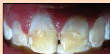
Slika 20. Uklanjanje viška fiksirajućeg materijala

Posle infiltracione anestezije izvršeno je uklanjanje viška materijala (slika 20), zatim prepariranje tvrdih tkiva (slika 21).