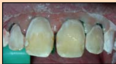
Slika 23. Nanošenje adheziva Single Bond