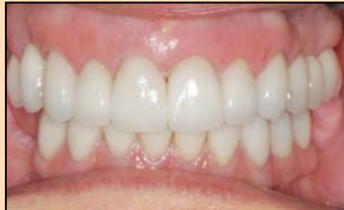
Slika 7. Predivne nove nadoknade vraćaju pacijentkinji osmeh na lice i omogućavaju joj da komforno žvaće po prvi put nakon dugo vremena