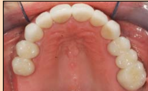
Slika 8. Maksimalne keramičke krunice nadoknađuju frakturirane, karijesne i abradirane zube