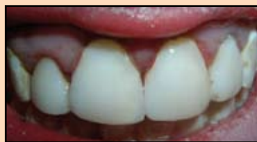
Slika 24. Konačni izgled restauracije

Posle jetkanja nanet je adheziv Single Bond (slika 23) i kru- nični deo zuba je obnovljen ma-