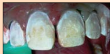
Slika 21. Prepariranje

Postojanje upalnog procesa i krvarenja desni u oblasti prednje grupe zuba zahtevalo je obavljanje retrakcije desni uz pomoć retrakcionog konca, zatim je izvršeno jetkanje gleđi preparatom Ultra-Etch (Slika 22).