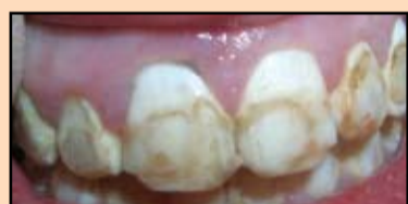
Slika 19. Stanje posle skidanja fiksne proteze

Spoljašnji izgled posle skidanja fiksne proteze prikazan je na slici 19. Treba istaći postojanje viška materijala za plombranje na kontaktnim površinama prednje grupe zuba.