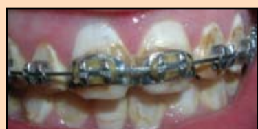
Slika 18. Početna situacija

St. localis: na zube je postavljena fiksna proteza. Otkriven je hronični kataralni gingivitis (Slika 18).