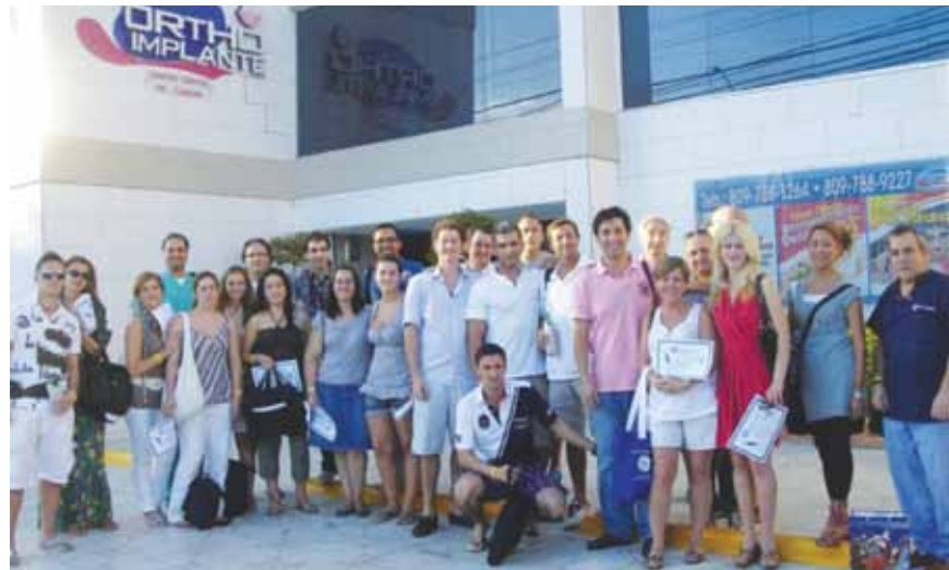
• L'équipe du Q-Implant Marathon avec des participants à Santo Domingo. • The Q-Implant Marathon team with participants in Santo Domingo.