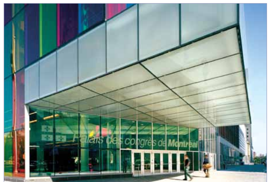
• Montréal Convention Centre, venue for JDIQ. (Photo/Provided by Marc Cramer, Palais des congrès de Montréal). • Montréal Convention Centre, venue for JDIQ. (Photo/Provided by Marc Cramer, Palais des congrès de Montréal)