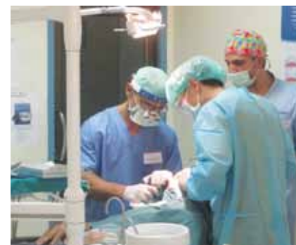
• Participants du Q-Implant Marathon travaillant en équipe à Santo Domingo. • Q-Implant Marathon participants in Santo Domingo working in a team.

ing the surgery, questions about surgical treatments are addressed.