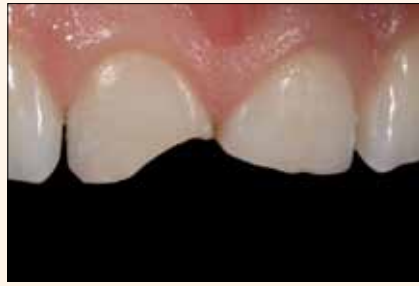
Situación inicial: fracturas en los incisivos 11 y 21.

Hoy en día, la estética dental es para muchos un aspecto importante de la calidad de vida. Y por consiguiente, cada vez más pacientes desean restauraciones invisibles y naturales de alta calidad, especialmente en la zona de los dientes anteriores. Con ello, aumenta la demanda de materiales de restauración altamente eficaces, los cuales no deben destacar únicamente por sus propiedades físicas, sino sobre todo por su facilidad de manipulación. Amaris es un composite con un innovador sistema de color especialmente desarrollado para lograr restauraciones altamente estéticas, que permite una gestión sencilla y cómoda del color a partir de unos pocos tonos. Amaris ha recibido múltiples distinciones, por ejemplo del prestigioso Instituto Estadounidense de Evaluación «The Dental Advisor».