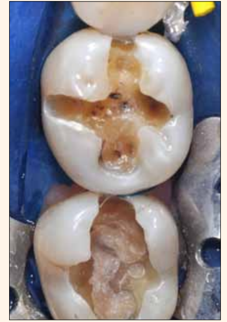
Fig. 3. Se remueven las amalgamas.