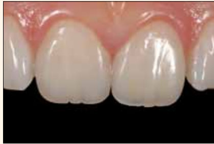
Restauración de los dientes anteriores con Amaris