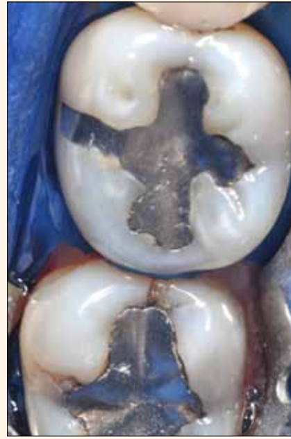
Fig. 2. Se coloca Optradam antes de la remoción de las restauraciones para evitar que el paciente trague residuos de partículas de amalgama

La Figura 4 muestra el uso de instrumentos oscilatorios: la pieza de mano Sonicflex (Kavo, Alemania) oscila en el rango sónico. Las puntas especialmente diseñadas por Komet (Brasseler, Alemania) tienen un lado pulido que queda en contacto con el diente vecino durante la preparación, y el lado que queda en contacto con el diente a tratar está diamantado, siendo éste el que realiza la preparación (Figs. 5a y 5b).