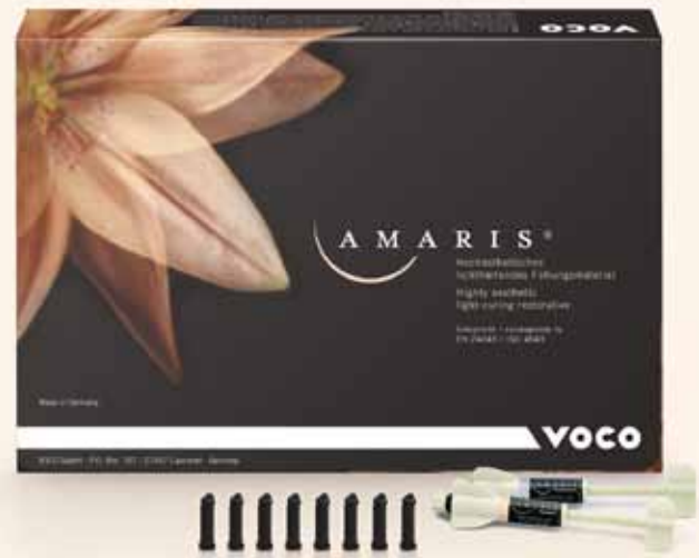
Restauración de los dientes anteriores con Amaris

El objetivo del creador de Amaris era lograr ajustarse en la mayor medida posible al diente natural. El Dr. Reinhard Maletz, jefe del área de Investigación y Desarrollo, explica: «El concepto de Amaris está enfocado a la estratificación y coloración naturales, no a un estándar industrial predeterminado. Amaris permite una transición fluida del color y una adaptación armoniosa a la sustancia dental circundante. Las restauraciones elaboradas con Amaris presentan una proporción natural entre opacidad y translucidez, así como una excelente fluorescencia y dinámica de luz. Gracias a ello, no es posible diferenciarlas de los dientes naturales».