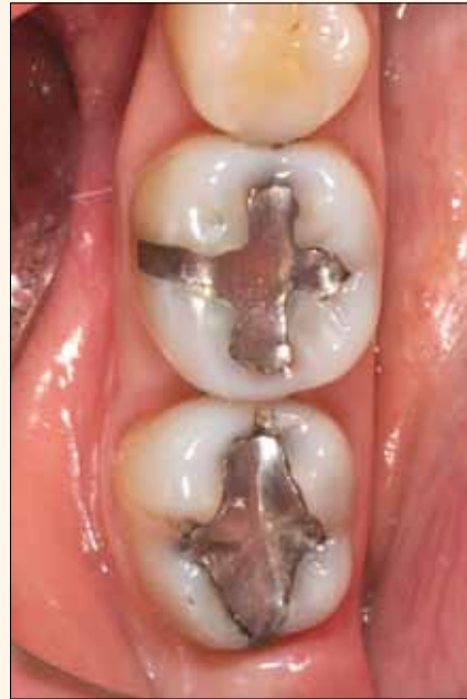
Fig. 1. Situación preoperatoria.

Luego de realizar el examen clínico, diagnóstico y plan de tratamiento, se procedió a anestesiarse a la paciente y a realizar una aislación absoluta con goma dique (Optradam, Ivoclar Vivadent) antes del retiro de las amalgamas, para evitar que la paciente reciba o trague pequeñas partículas tóxicas (Fig. 2).