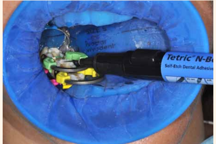
Tetric N Bond (Ivoclar Vivadent, Liechtenstein)

Continuamos con un artículo sobre el avance de los llamados adhesivos universales, que pueden ser utilizados tanto con la técnica de grabado total, selectivo o autograbado, per-