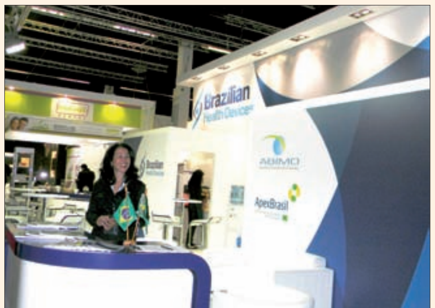
El área de recepción de ABIMO, la asociación de la industria médica y dental de Brasil.