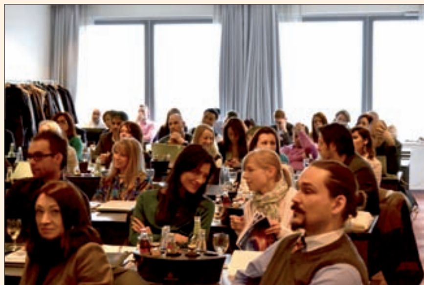
Un grupo de editores y directores de Dental Tribune International durante la 9ª Reunión de Editores de la compañía, que edita más de 100 publicaciones.

Ripano tiene filiales franquiciadas en todos los países de Latinoamérica, pero como parte del proyecto de consolidación con DTI este año abrirá delegaciones propias en Perú, Ecuador, Colombia, México y Venezuela.