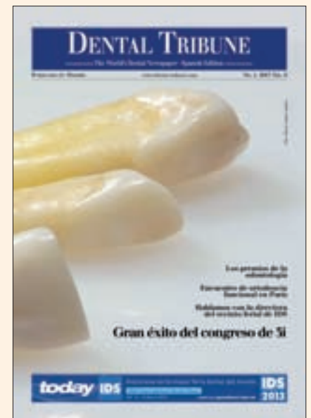
Portada del primer número de Dental Tribune Spain editado por Ripano.

Además, es la editorial de reconocidas organizaciones científicas internacionales como ALODYB (Asociación Latinoamericana de Operatoria Dental y Biomateriales), ALOP (Asociación Latinoamericana de Odontopediatría), SPO (Sociedad Peruana de Odontopediatría), AIO (Asociación Iberoamericana de Ortodontistas), IFUNA (International Functional