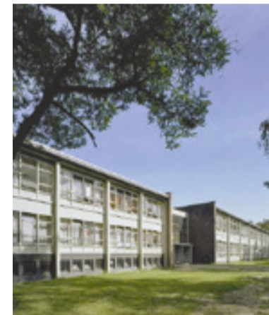
De oude Koningin Wilhelminakazerne in Ossendrecht is nu in gebruik als asielzoekerscentrum.

Voorheen kreeg een tandarts bij de bevestiging van de afspraak het zogenaamde 'Toegeleidsingsformulier' mee. Hierop stonden uitgebreide gegevens over de patiënt: welke taal hij/zij sprak, een beschrijving van de klacht en antwoord op een aantal medische vragen. In de nieuwe procedure ontvangt een tandarts